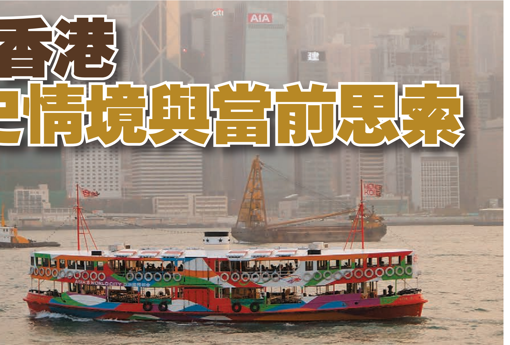
■無論歷史與現實，香港都與祖國密不可分。