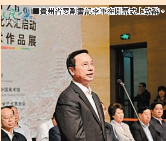
■貴州省委副書記李軍在開幕式上致辭。

香港文匯報訊（記者 王曉雪、實習記者 聶晨靜 北京報導）2014年「多彩貴州」國際原生態文化大匯活動啟動暨「多彩貴州——中國美術作品展」開幕式25日在中國美術館舉行。這是繼西藏、新疆和內蒙古主題之後，由中國美協策劃的以中國少數民族為主題的第四個國家級大型美術活動。此次展覽由中國文聯、貴州省委宣傳部、中國美術家協會等共同主辦。貴州省委副書記李軍在致辭時表示，這是建國以來在中國最高美術殿堂第一次舉辦貴州題材的美術展覽。精選的不僅有幾代貴州畫家的作品，還有吳冠中、劉海粟等大師們描繪的貴州印象，這是貴州地域題材美術創作在中國美術史上的一次重要定格。