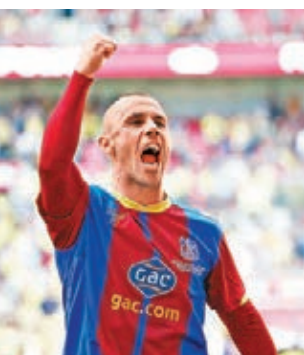
■菲臘斯告別球員生涯

現年40歲的英格蘭前鋒菲臘斯在助英冠李斯特城升上英超後宣布退役，這位前國腳先後曾助新特蘭、西布朗、伯明翰、水晶宮及李城升班，1999至2000年球季更以30球成為英超神射手及歐洲金靴獎得主。