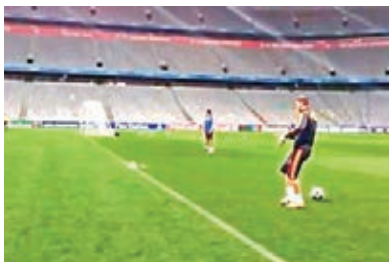
■沙治奧拉莫斯表演。網上圖片

提到美斯，阿根廷「球王」去年曾表現底線後將球射入網的神技，宿敵皇家馬德里西班牙後衛沙治奧拉莫斯昨在德國練波時也在底線後射門，皮球彎向龍門彈地入網。可到網址 www.youtube.com/watch?v=G8cEFuuav0s 睇片。