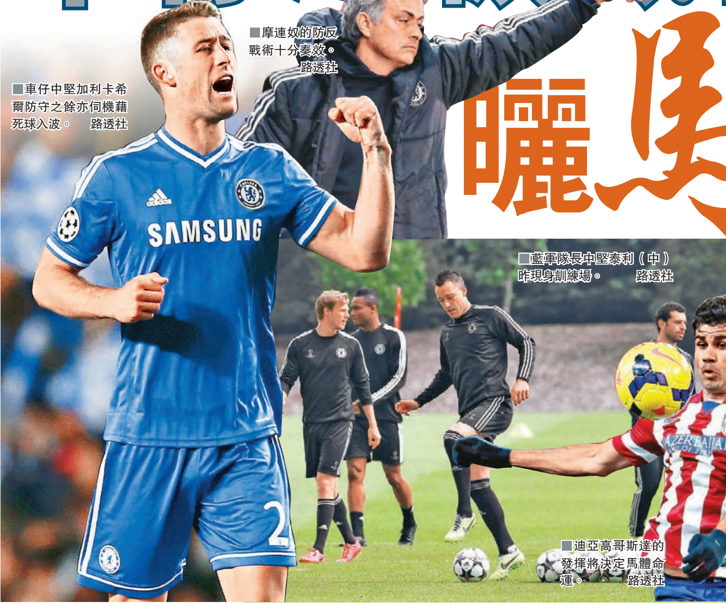
■摩連奴的防反戰術十分奏效。