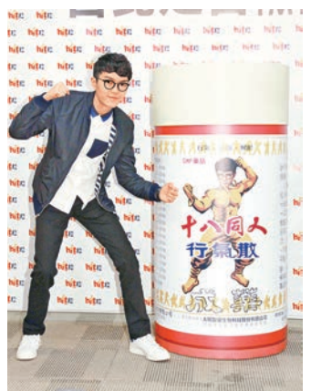
電台將大同的臉合成，將其化身為肌肉男。

香港文匯報訊（記者 凡文）方大同昨日在台北參加電台活動，得悉大同忙於宣傳新專輯和籌備巡迴演唱會，電台特別將大同的臉合成，讓他變為「五五身」的肌肉男，並以此製作「十八『同』人行氣散」，希望給大同滿滿元氣，順利走完宣傳行程。