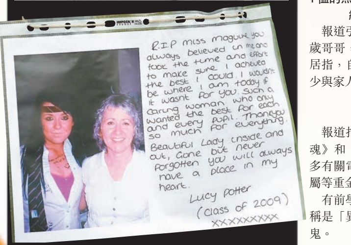
■不少學生在與馬圭爾的合照旁，寫上悼念字句。