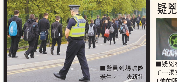
■警員到場疏散學生。