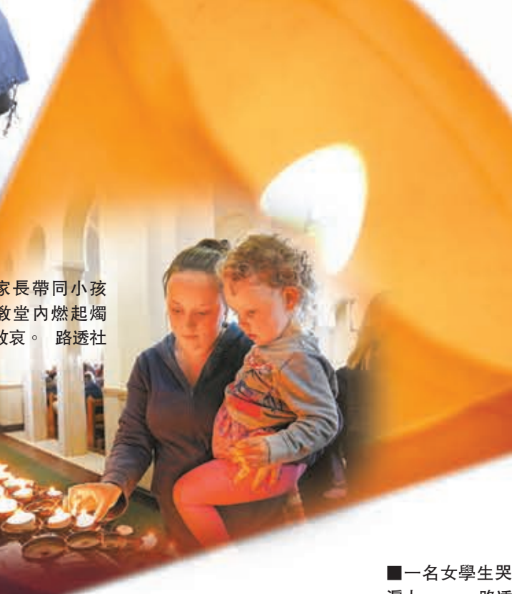
■一名女學生哭成淚人。