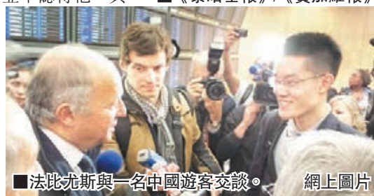
■法比尤斯與一名中國遊客交談。

多語言指示牌不足，又無足夠人員向旅客解釋地面接駁交通。 每年約有150萬名中國遊客到法國旅遊，人均消費約1,300歐元(約1.4萬港元)，為吸引更多華人及全球各地民眾到來，法國政府正展開一項40年計劃，鼓勵服務業人員多展示笑容。法國兩大百貨公司老佛爺及春天百貨亦聘有數百名懂普通話的店員招待華客。 ■《泰晤士報》/《費加羅報》