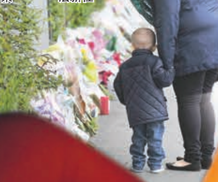
■有家長帶同孩子到學校放下花束。