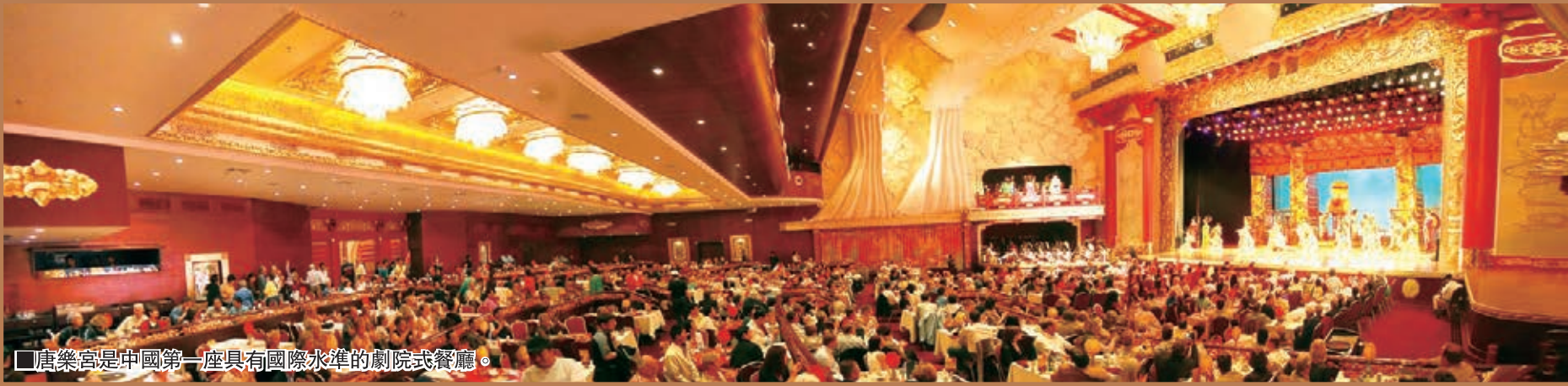
唐樂宮是中國第一座具有國際水準的劇院式餐廳。