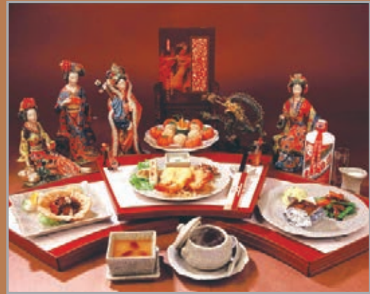
唐樂宮以仿唐菜結合粵菜、西餐等創制成獨特的「宮廷宴」。