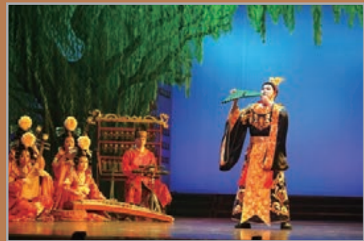
唐樂宮的《春鶯囀》是中國唯一用仿唐排簫獨奏的曲目，在當今國內絕無僅有。