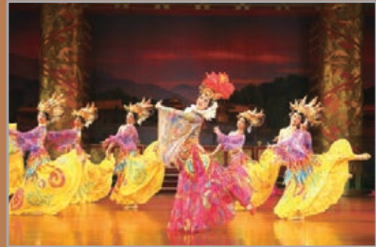
霓裳羽衣舞再現了唐代藝術家的豐富想像和楊貴妃的優美舞姿。