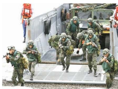
台灣海軍陸戰隊日前演練搶灘登陸。

香港文匯報訊 據台灣《聯合報》報道，台灣海軍陸戰隊在島內民眾心目中以彪悍著稱，在台南下階段裁軍案下，面臨「人船分離」的局面。台「國防部」有意將陸戰隊人數減半，並且移往澎湖；不過海軍反對，質疑當局「不懂陸戰隊的價值何在」，認為陸戰隊的價值就是快速部署、快速反應，調往缺乏兩棲設施的澎湖，「陸戰隊就不是陸戰隊了」。