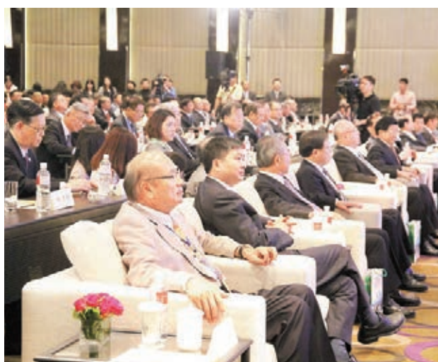
論壇會場座無虛席。