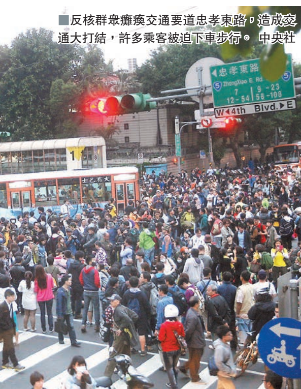
反核群眾癱瘓交通要道忠孝東路，造成交通大打結，許多乘客被迫下車步行。