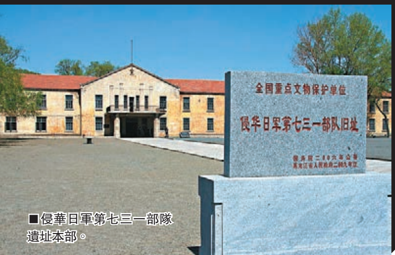
侵華日軍第七三一部隊遺址本部。