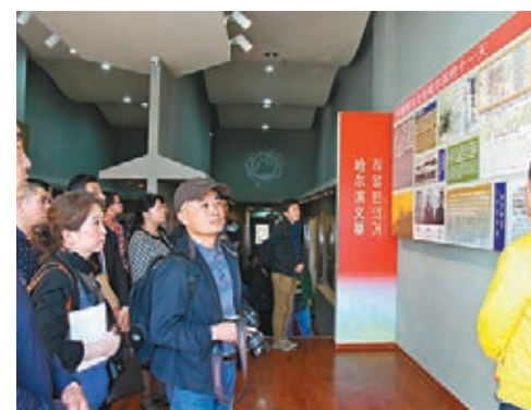
安重根紀念館自開館後，參觀者絡繹不絕。

1909年10月26日9時30分，來自朝鮮半島的抗日義士安重根在哈爾濱火車站的站台