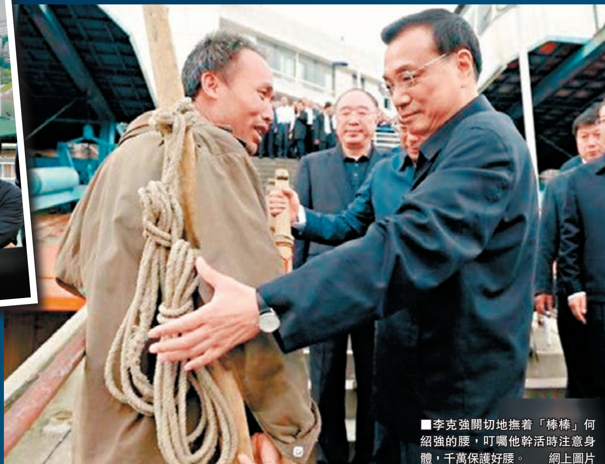
李克強關切地撫着「棒棒」何紹強的腰，叮囑他幹活時注意身體，千萬保護好腰。網上圖片

香港文匯報訊（記者 張蕊、孟冰 重慶報道）國務院總理李克強昨日視察重慶，在重慶萬州工業園視察企業，在萬州港口與「棒棒」們（碼頭搬運工）交談，乘船考察長江黃金水道。李克強在與「棒棒」交談時，強調「推動中國發展需要負重前行、爬坡越坎、敢於擔當、不負重托的『棒棒精神』。」這也是2012年11月中共十八大以來，首位赴渝考察的中央政治局常委。