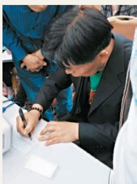
家屬現場簽名，要求波音公司回答問題。

另外，澳洲聯合協調中心27日發表媒體通報稱，由於天氣條件惡化，當天的空中和海上搜索暫停，但水下搜索始終進行。藍鯨金槍魚潛航器已經完成第14次下潛任務，於昨日上午執行15次搜尋任務。但截至目前，並無新的發現。此前澳方表示，藍鯨金槍魚潛航器對該區域的搜尋工作已完成95%以上。若在所劃定區域的搜尋完成後仍無發現，將擴大搜尋範圍。