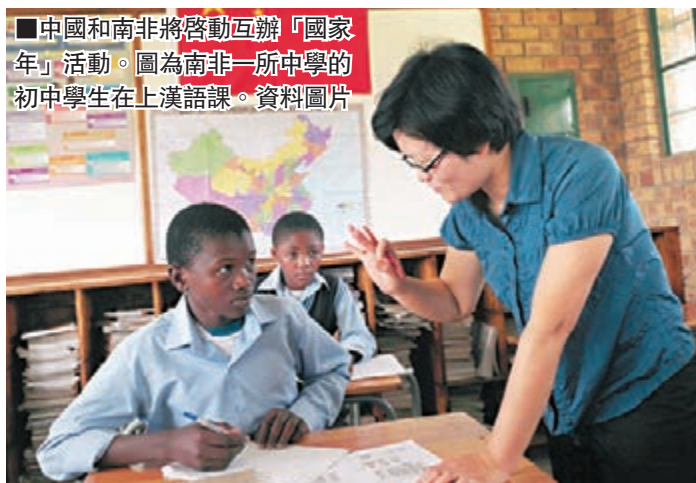
中國和南非將啟動互辦「國家年」活動。圖為南非一所中學的初中學生在上漢語課。資料圖片

「此行最大的感受是中國與拉美在發展上具有高度互補性，雙方是天然的合作夥伴，完全可以實現共同發展、共同繁榮。」王毅說，作為一個大國，中國外交有足夠的戰略定力和戰略自信，也完全有能力保持戰略主動，不會因一時一事或某些人、某些國家的言論而受到影響。中方將堅定不移推進既定的外交方針政策。因為這不僅符合中國人民的利益，也符合世界人民的利益。不僅符合中國的發展方向，也符合世界進步的潮流。