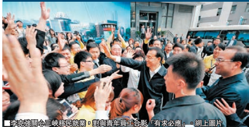
李克強關心三峽移民就業，對與青年員工合影「有求必應」。

重慶市委書記孫政才、重慶市長黃奇帆昨日全程陪同李克強的考察活動。在萬州工業園，當李克強了解到政通通信公司吸納大量當地三峽移民就業時，他欣慰地說：「我最關心的是大家就業。有了就業就有收入，就能逐步過上好生活。」而對年輕職工多次提出合影等要求，李克強「有求必應」。在離開公司前，公司職工紛紛從陽台、窗戶內向樓下的總理招手示意，李克強看到後立刻駐步，笑容滿面地向樓上的群眾招手問好。