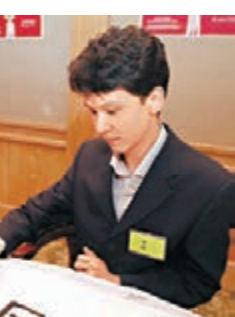
選手比賽毛筆字。新華社

據新華社報道，本次選拔賽分即興演講、回答評委提問、知識問答以及才藝表演4個環節。多位選手在演講比賽中展現了對漢語嫺熟的駕馭能力，他們還進行了演唱中文歌曲、表演中國民族舞蹈、書寫漢字、朗誦中文詩歌等才藝表演。