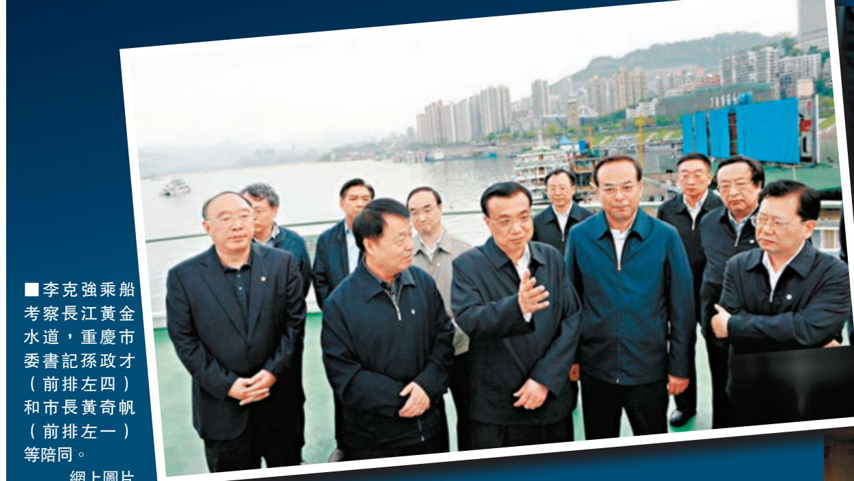
李克強乘船考察長江黃金水道，重慶市委書記孫政才（前排左四）和市長黃奇帆（前排左一）等陪同。