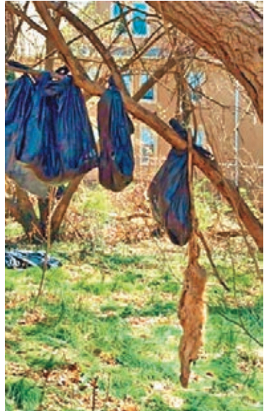
有貓屍跌出膠袋外。

美國紐約州揚克斯市驚現連環殺貓狂徒，清潔工人前日在當地郊區一處空地，發現大批膠袋掛在樹上，內裡共裝着 25 具貓屍，明顯是遭人以鈍器重擊頭部致死，地上並有貓隻骸骨，令人毛骨悚然。當局正調查事件，揣測兇徒或是報復民眾餵飼流浪貓，當地人皆擔心個人安全受威脅。