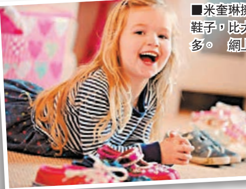
米奎琳擁有的鞋子，比大人還多。網上圖片