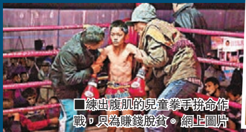
練出腹肌的兒童拳手拚命作戰，只為賺錢脫貧。網上圖片