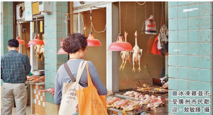
■冰凍雞並不受廣州市民歡迎。

香港文匯報訊(記者 敖敏輝 廣州報道)記者從廣州市食安辦及農業部門獲悉，因考慮防控禽流感，廣州出家禽集中屠宰、冰鮮上市管理辦法，從5月1日起，試點工作正式在越秀等四區推行，而在10月份開始，該辦法在全市鋪開，廣州也將成為內地首個禁活禽交易的城市。廣東連續多年出現禽流感疫情，省會廣州是全省最大的家禽交易集散中心，也是最大的禽肉銷售市場。自去年以來的H7N9禽流感疫情爆發以來，廣州出現多例感染者。