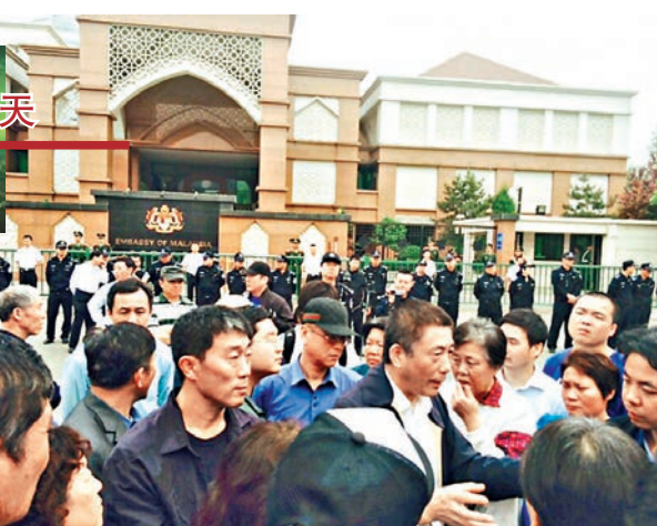
■北京市公安局領導馬大使館前安撫抗議家屬。

香港文匯報訊(實習記者張聰 北京報道)25日下午60名馬航MH370失聯客機中國乘客家屬手持標語再次來到馬來西亞駐華大使館靜坐抗議要求會見馬來西亞駐華大使，並向其當面遞交家屬請願書，強烈抗議馬來西亞駐華使館拒絕召開家屬見面會，以及馬來西亞副外長20日發表的有關考慮在合適的時間宣佈客機遇難無人失蹤，並辦理發放死亡證明等手續的言論。