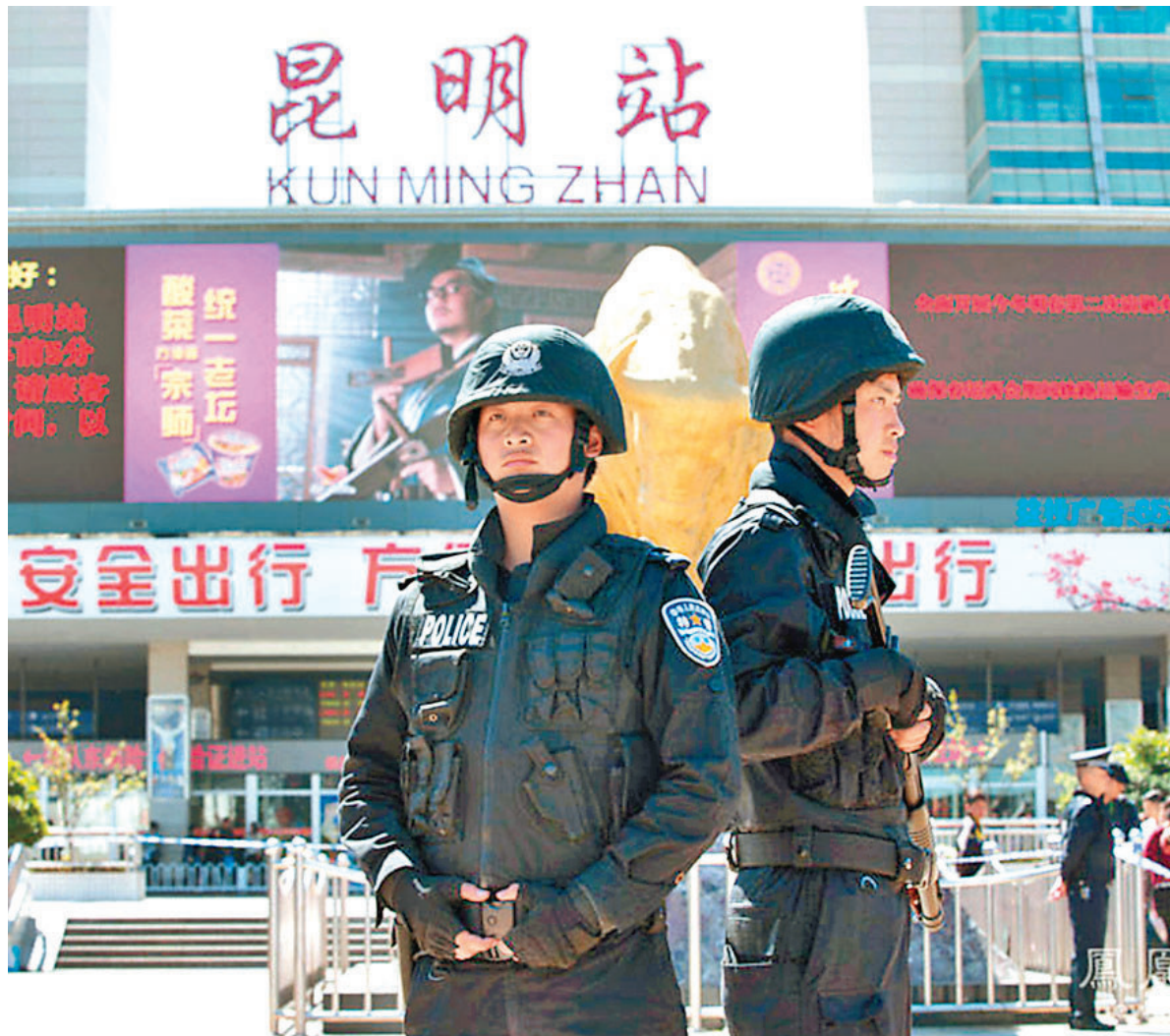
■昆明火車站暴力恐襲後，中央加強反恐。圖為軍警在車站執勤。

習近平強調，維護國家安全，必須從制度、機制、政策、工作上積極推動社會矛盾預防化解工作。加強保障和改善民生工作，從源頭上預防和減少社會矛盾的產生。要完善和落實維護群眾合法權益的體制機制，完善和落實社會穩定風險評估機制，預防和減少利益衝突。要全面推進依法治國，更好維護人民群眾合法權益。對各類社會矛盾，要引導群眾通過法律程序、運用法律手段解決，推動形成辦事依法、遇事找法、解決問題用法、化解矛盾靠法的良好環境。