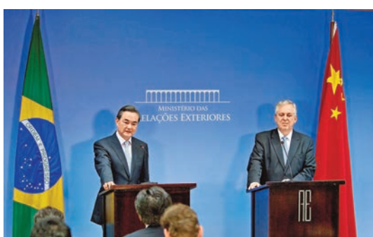
■中國外交部長王毅(左)與巴西外長馬沙多共同會見記者。

香港文匯報訊 中國外交部網站昨日發佈消息稱，中國外交部長王毅與巴西外長馬沙多25日在巴西利亞舉行首次中巴外長級全面戰略對話。