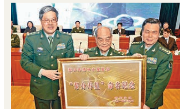
■南京軍區司令員蔡英挺(右一)政委鄭衛平(左一)為中國工程院院士黎介壽頒授紀念匾。

香港文匯報訊 據新華社報道，中國工程院院士、南京軍區南京總醫院副院長黎介壽，25日在南京舉行的命名儀式上，接過國際小行星中心「黎介壽星」的命名證書、照片和運行軌道銅牌，正式獲得永久性小行星命名。命名為「黎介壽星」的小行星是由中國紫金山天文台盱眙觀測站於2007年3月在國際上首次發現的，距離地球約2.21億公里，國際編號為(192178)。2014年1月16日，國際小行星中心發佈公告，國際編號為(192178)的小行星被正式命名為「黎介壽星」。