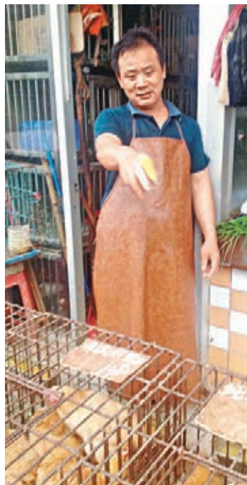
■雞檔老闆張先生稱，拔毛後的雞，市民無法分辨雞是好雞還是質量差的雞，市場或出現以次充好的現象。