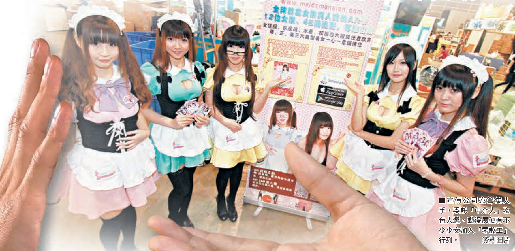
宣傳公司為籌集人手，委託「中介人」物色人選。動漫展便有不少少女加入「零散工」行列。 資料圖片

香港文匯報訊（記者 郭兆東）有人喜歡合約長工夠穩定，亦有人鍾情零散工無合約夠自由。本港現時有逾15萬名零散工，每逢長假都會在商場及街頭宣傳活動中「炒散搵真銀」，但有部分因貪圖一時之快，誤信口頭承諾可代替正式僱傭合約，最後公司疑似倒閉，非但未獲發薪，更無法追討，賠了夫人又折兵。據悉，有事主透過中介人接獲工作，當時中介人曾以口頭承諾，會以月結形式支付時薪，但事後公司倒閉，中介人連同事主同遭欠薪，惟事主因未有簽下合約，向勞工處求助不果，如今只能期望中介人能追回欠款再支薪。