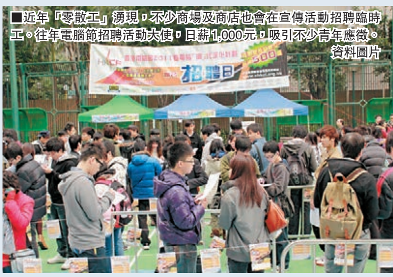
近年「零散工」湧現，不少商場及商店也會在宣傳活動招聘臨時工。往年電腦節招聘活動大使，月薪1,000元，吸引不少青年應徵。 資料圖片

香港文匯報訊（記者 郭兆東）有人力資源顧問公司指出，長假期間的青年勞力資源大幅增加，但勞力市場並未有出現勞力過盛情況，因不少商場及商戶都會進行連串宣傳活動，需要大量人手。顧問公司亦指，預計長假期間會繼續缺人，相信屆時會有更多青年投入散工市場，時薪有望突破80元水平。