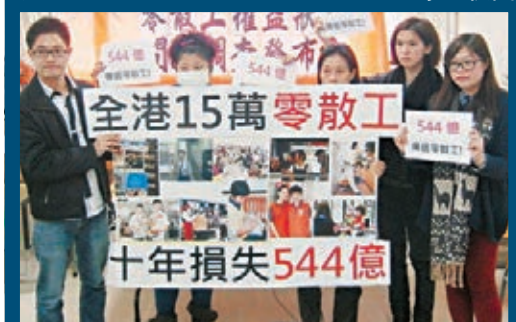
部分「零散工」遇公司疑似倒閉，非但未獲發薪，更無法追討。 資料圖片

香港文匯報訊（記者 郭兆東）有人喜歡合約長工夠穩定，亦有人鍾情零散工無合約夠自由。本港現時有逾15萬名零散工，每逢長假都會在商場及街頭宣傳活動中「炒散搵真銀」，但有部分因貪圖一時之快，誤信口頭承諾可代替正式僱傭合約，最後公司疑似倒閉，非但未獲發薪，更無法追討，賠了夫人又折兵。據悉，有事主透過中介人接獲工作，當時中介人曾以口頭承諾，會以月結形式支付時薪，但事後公司倒閉，中介人連同事主同遭欠薪，惟事主因未有簽下合約，向勞工處求助不果，如今只能期望中介人能追回欠款再支薪。