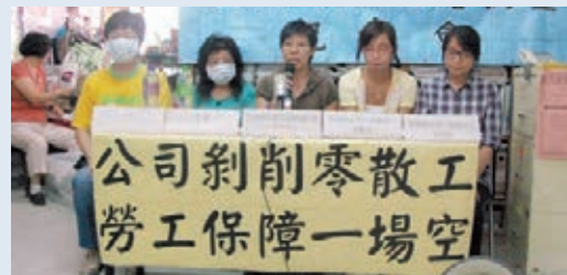
不少僱主剝削「零散工」權益，招致工人不滿。 資料圖片

資給所有僱員。僱傭合約是指僱主與僱員訂立的僱傭協議，可以「書面」或「口頭」方式訂立，並可包含明示或暗示條款。此外，若僱員為同一僱主每星期工作18小時或以上，並受僱4星期或以上，即使僱傭模式與兼職僱員類似，亦需如全職僱員般，享有《僱傭條例》下所有福利，例如休息日、有薪法定假日、年假、疾病津貼、遣散費、長期服務金等。