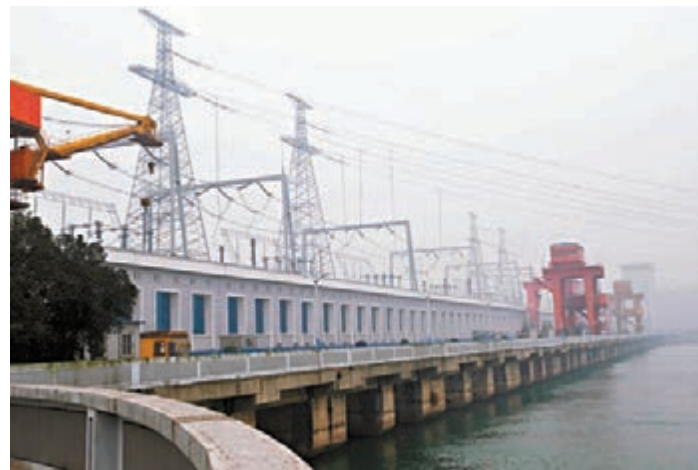
圖為葛洲壩大江電廠。資料圖片

道富SPDR工業指數基金中的公用事業板塊基金，上季錄得10.09%漲幅，優於排行次位、健康護理板塊指數基金的5.86%漲幅之餘，也遠優於道富SPDR標普500指數基金期間的1.7%漲幅。