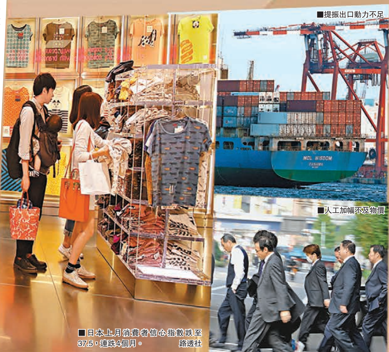
■提振出口動力不足

至於日央行會否在年內進一步推出QE,高盛經濟師馬場直彥及田中由利子預計,除非能源價格顯著增加,或日圓匯價下跌勢頭持續,否則日本通脹率在本月或下月已見頂,央行或於7月議息時加推QE。不過東京RBS證券首席經濟師西岡純子認為,日本經濟改善符合央行預期,除非金融市場出現突變,央行才會在今年內再出手。 ■彭博通訊社/共同社/《華爾街日報》/CNBC