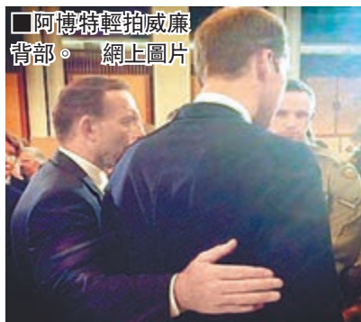
■阿博特輕拍威廉背部。

英國王室禮節規定,除握手外,非王室成員不可與王室成員有任何身體接觸。1992年,澳洲前總理基廷以左臂輕抱英女王伊利沙伯二世,被外界詬為「澳洲蜥蜴」。近年涉及這禮儀問題的最大事件,要數2009年美國總統奧巴馬伉儷訪英,第一夫人米歇爾用左手輕抱女王,但女王竟然順勢回抱米歇爾,令輿論震驚。 ■《每日郵報》