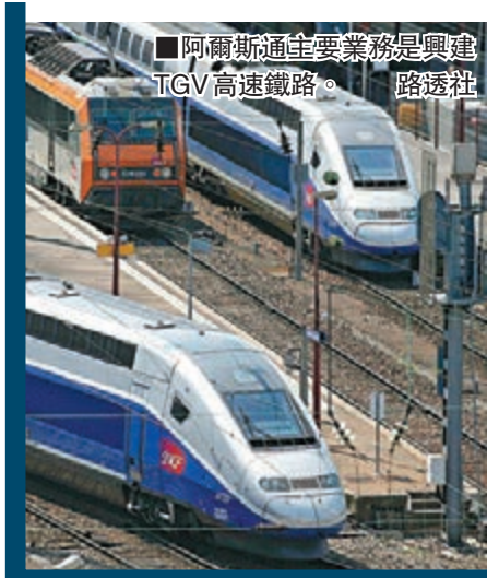
■阿爾斯通主要業務是興建TGV高速鐵路。路透社