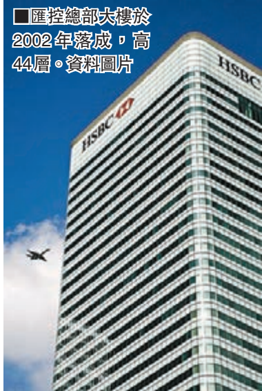
■匯控總部大樓於2002年落成,高44層。

英國《金融時報》引述消息稱,位於倫敦的匯豐控股環球總部大樓,將叫價逾11億英鎊(約143億港元)放售,有機會打破英國商業大廈成交紀錄。分析相信這代表當地商廈交投市場再度熾熱。