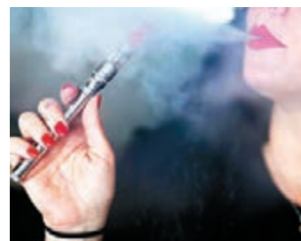
美國很多青少年吸食電子煙。

近年電子煙愈來愈流行，在多國引起是否需引入監管的爭議。美國食品和藥物管理局(FDA)前日首次提出電子煙監管草案，措施包括禁止向青少年出售電子煙，須在電子煙包裝盒印上健康警告等。