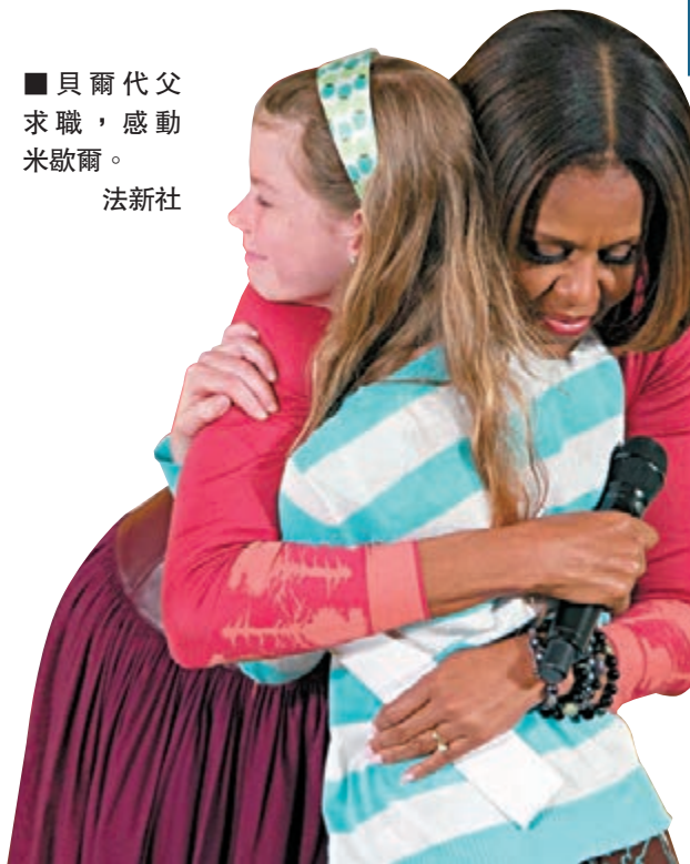
貝爾代父求職，感動米歇爾。

美國第一夫人米歇爾前日響應年度「帶子女上班日」活動，邀請華府多個部門職員的子女出席，其間一名10歲孝順女把握機會，向米歇爾遞上失業父親的履歷表，希望對方能協助。米歇爾深受感動，更兩度擁抱女童。