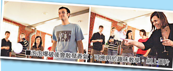
泡泡爆破後會散發香氣，可應用於趣味教學。