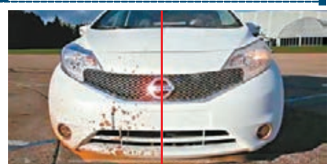
左邊沒有塗上納米車漆，與使用塗漆的右邊對比強烈。

相信不少駕駛人士最怕雨天開車，以免車身被雨水和路面積水弄污。日產車廠最近研發出一種納米塗漆，讓汽車自動去除污漬。日產在英國的工程師正在去年10月推出的日產Note上測試這塗漆，未來可能會供其他車款塗上。納米塗漆能抵抗水漬、油污、泥污、雨水及日常污漬，原理是在車漆表面形成空氣薄膜，防止雨水或污水在車身留下痕跡，估計每次塗漆需450英鎊(約5,866港元)。 《每日郵報》