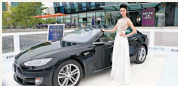
萬科與特斯拉合作，力推新項目的生態環保概念。圖為其鹽田壹海城展示的特斯拉跑車。

香港文匯報訊(記者 李昌鴻 深圳報道)萬科、招商地產共同發展的「壹海城壹灣」日前在鹽田舉行發布會。萬科相關負責人談到，壹海城既是鹽田兌現配套規劃的重要組成部分，也是30周年的萬科轉型「城市配套服務商」的重要一環，因此一定要將壹海城的產品做到極致。