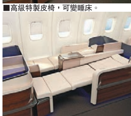
■高級特製皮椅，可變睡床。