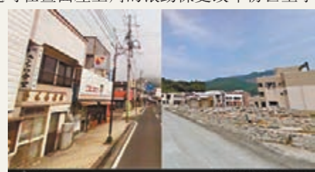
■2008年日本(左)與2011年大地震後(右)對比強烈。