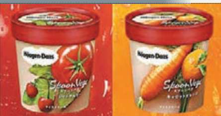
■番茄車厘子味(左)及紅蘿蔔橙味。

雪糕因熱量及脂肪含量高，令不少人卻步。著名雪糕品牌Häagen-Dazs有見及此，計劃下月12日在日本推出迷你裝蔬果味雪糕，標榜奶脂含量超低，有番茄車厘子味及紅蘿蔔橙味，每杯售284日圓(約21.5港元)。