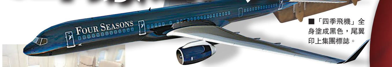
■「四季飛機」全身塗成黑色，尾翼印上集團標誌。

為迎合新一代豪客對奢華的追求，加拿大四季酒店集團推出全新「四季飛機」，以一架經改裝的波音757客機，接載遊客環遊世界。全程包食宿及陸上交通，保證入住四季旗下酒店，每位收費11.9萬美元(約92.3萬港元)。