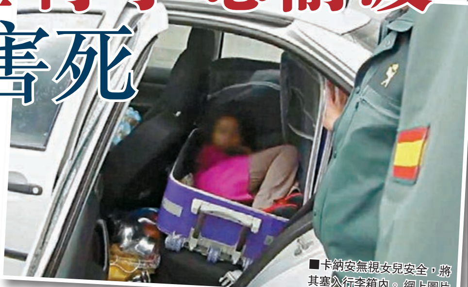
■卡納安無視女兒安全，將其塞入行李箱內。

摩洛哥一名單親爸爸獲得西班牙工作簽證，但捨不得與8歲愛女分隔兩地，居然把女兒藏在行李噏內，試圖將她偷運入境。西班牙海關人員揭發事件時幾乎嚇壞，慌忙把女孩送院，幸她並無大礙。父女情深更打動西班牙法官，允許女兒合法留在西班牙陪伴爸爸。