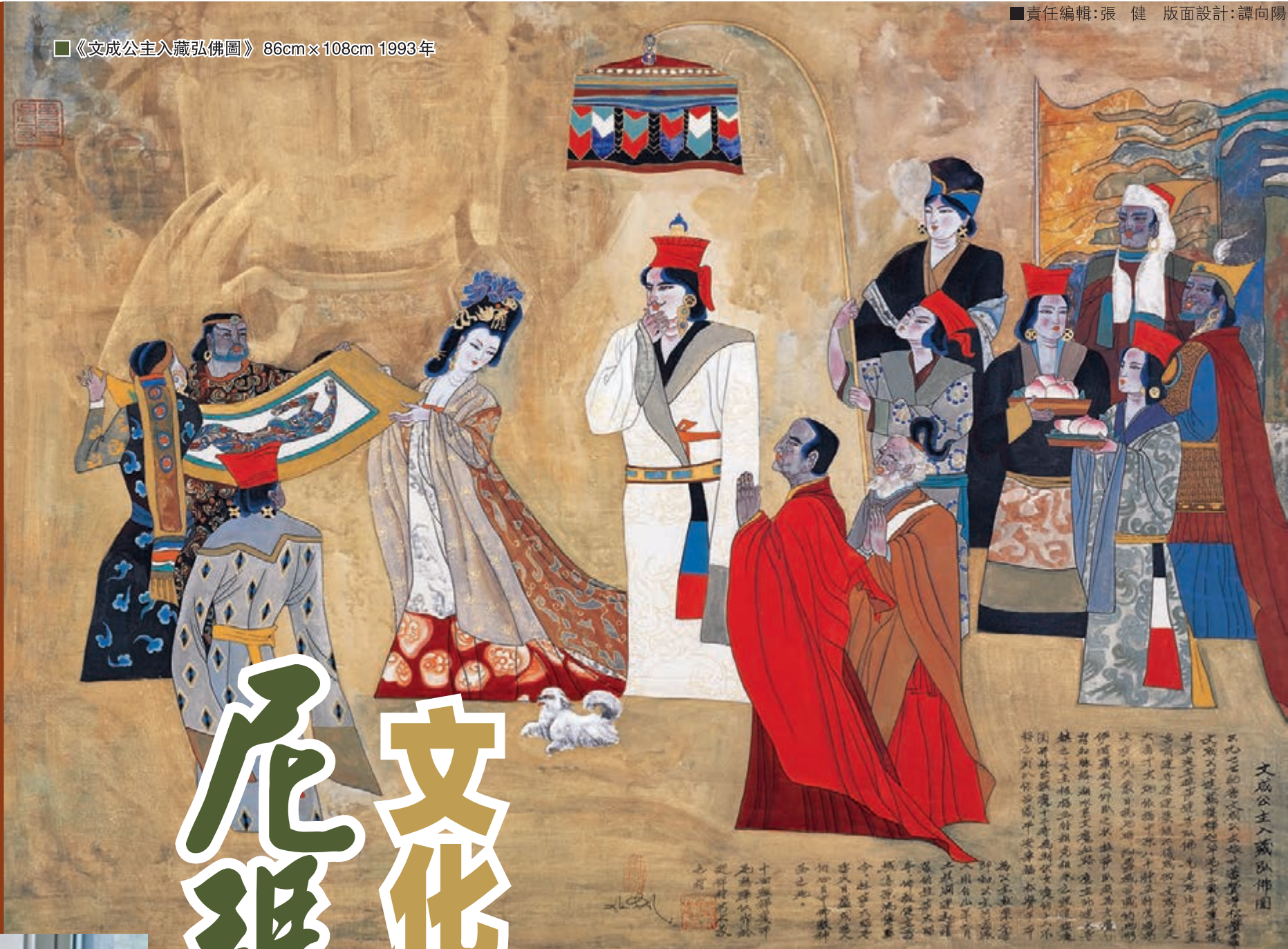
■《文成公主入藏弘佛圖》86cm×108cm 1993年