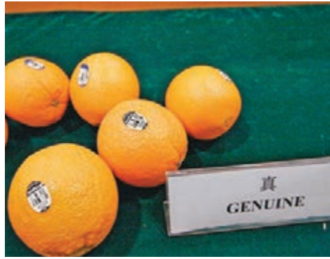
正貨「新奇士」橙標籤屬膠質及有兩組條碼。