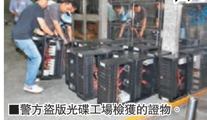
警方盜版光碟工場檢獲的證物。

香港文匯報訊 (記者 杜法祖) 2個黑幫組織實行「有錢一齊搵」，暗中聯營一個由生產到銷售「一條龍」式鹹碟集團，為減省成本，集團更聘用內地人在光碟燒錄工場24小時工作，日產萬隻光碟，估計他們在4年至5年間營業額逾3,000萬元。警方新界南總區重案組根據情報及調查，前日採取代號「領先」行動，突擊搜查該集團分佈於葵涌、荃灣及旺角的生產工場、銷售店舖及主腦辦公地點與住所等，拘捕包括主腦在內等12人，另外檢獲總值逾50萬元的製成品及生產器材。