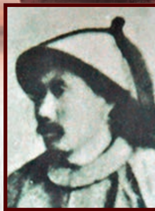
丁汝昌 北洋水師提督