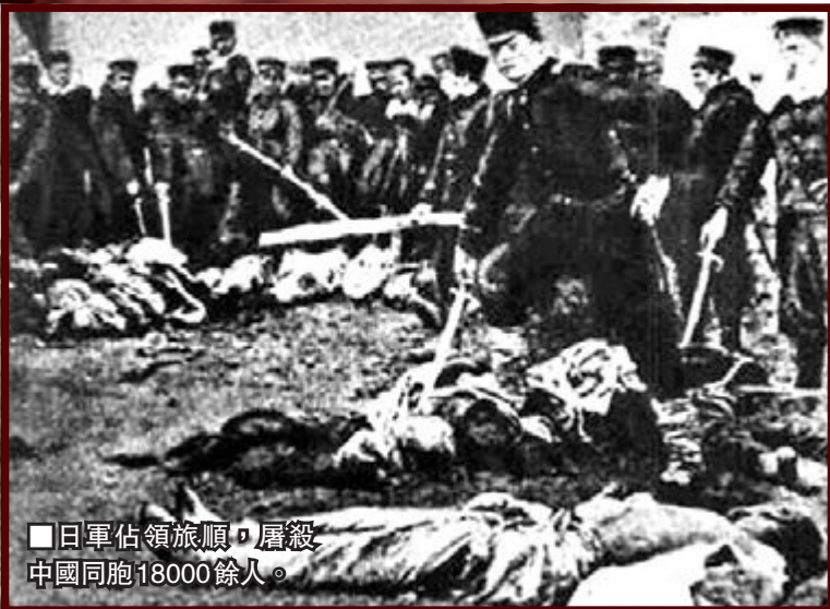
■日軍佔領旅順，屠殺中國同胞18000餘人。