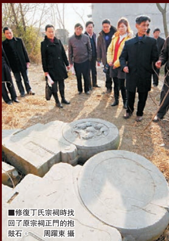
■修復丁氏宗祠時找回了原宗祠正門的抱鼓石。