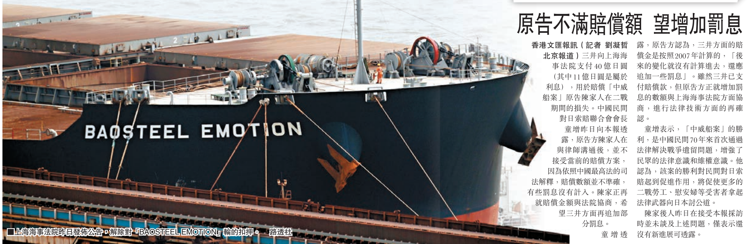
上海海事法院昨日發佈公告，解除對「BAOSTEEL EMOTION」輪的扣押。