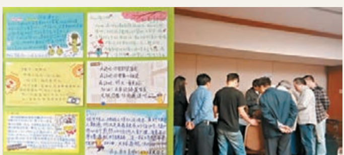
左圖為來自台灣的祝福卡。右圖為家屬們正在尋找屬於自己的祝福卡。

馬大使館人員拒溝通 然而，馬駐華大使館人員拒參加家屬溝通會的態度再次將家屬們的心「打」回了冰窟。在24日的家屬溝通會上，家屬們要求馬來西亞駐華大使館的工作人員前往參會，並告知成立國際調查組的目的、作用等問題。然而直至當晚20:30，馬駐華大使館始終未派人出面解釋。由於心力交瘁加之沒有按時食用晚餐，有家屬現場昏倒，