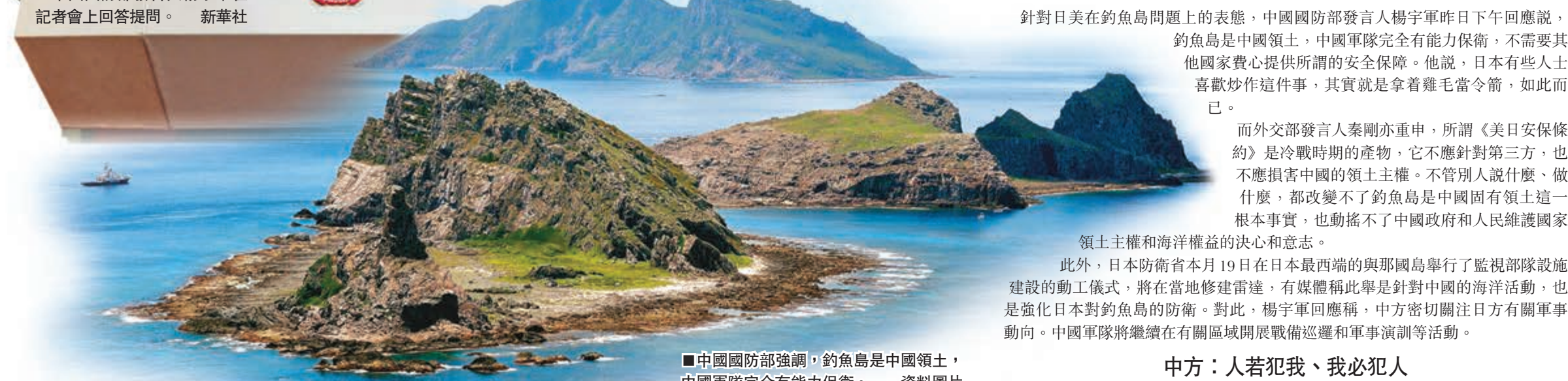
中國國防部強調，釣魚島是中國領土，中國軍隊完全有能力保衛。