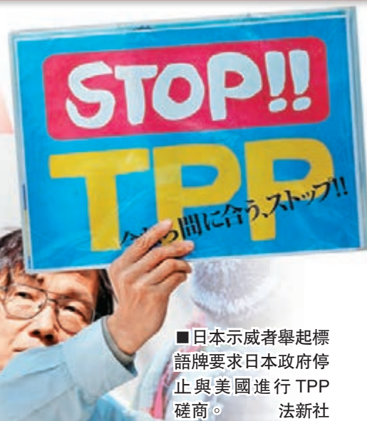
日本示威者舉起標語牌要求日本政府停止與美國進行TPP磋商。

閣列島(釣魚島)的內容，寫入共同聲明中。」日本經濟財政大臣甘利明和美國通商代表弗洛瑪在昨日下午進行了會談，但是，雙方依然在牛肉等的關稅稅率上意見相左。甘利明大臣在會談結束後表示：「雖然有所前進，但是還有課題殘留，需要繼續進行協商。」他還說：「不是在短時間內可以得出結論」，暗示在奧巴馬今日上午離開東京前，也難以達成協議。報道稱，宮中晚餐會結束後，安倍指示負責TPP問題談判的甘利明，想辦法盡快與美國達成協議。但至昨日深夜，日美兩國還沒有決定是否要舉行通宵談判。