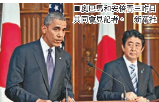
奧巴馬和安倍晉三昨日共同會見記者。

香港文匯報訊(記者 葛沖 北京報道)日本首相安倍晉三趁美國總統奧巴馬到訪之際，就中日釣魚島爭端而再向美國示好。在昨日的美日首腦會談中，安倍主張以美日同盟主導亞太，為美國「戰略再平衡」搖旗吶喊；而奧巴馬則重申日美安保條約適用於釣魚島，公開為日本壯膽。對於日本欲抱美國粗腿而向中國施壓的意圖，中國國防部發言人回應說，中國軍隊完全有能力保衛釣魚島，不需要其他國家費心提供所謂的安全保障，日本有些人士喜歡炒作所謂日美安保條約適用於釣魚島，其實就是拿着雞毛當令箭。