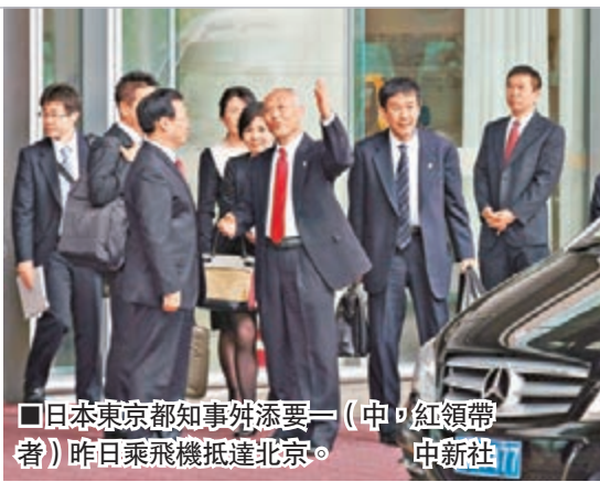
日本東京都知事舩添要一(中，紅領帶者)昨日乘飛機抵達北京。