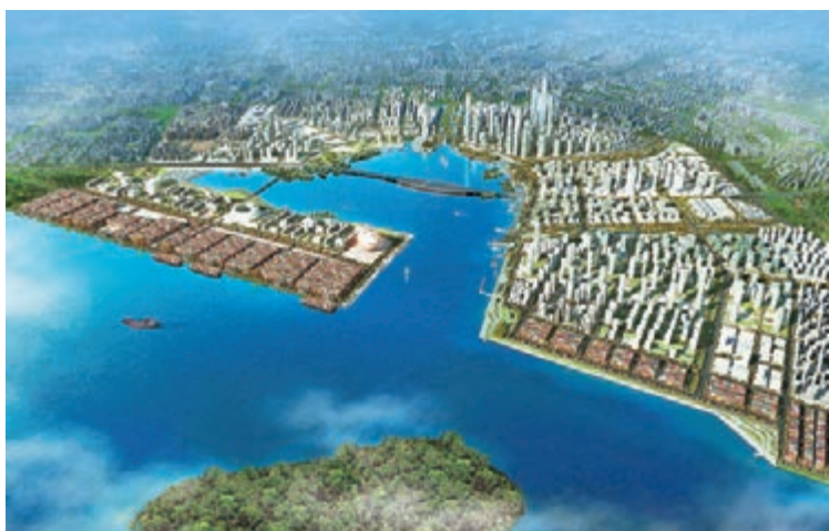
前海合作區對互聯網金融這一新興業態早有洞見，並從戰略高度予以重視，着手謀篇布局。

前海合作區對互聯網金融這一新興業態早有洞見，並從戰略高度予以重視，着手謀篇布局。據了解，今年內，前海管理局將大力推動基