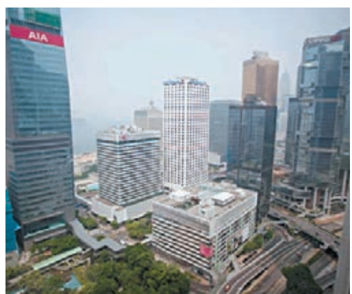
索羅斯前投資團隊籌備的對沖基金，最初資本至少為1.5億美元。

香港文匯報訊 索羅斯基金管理公司(Soros Fund Management)前投資團隊將在下季在香港成立一隻對沖基金，最初資本至少為1.5億美元，成為今年該地最大新創基金之一。最初資本包括HS Group提供的種子資金。