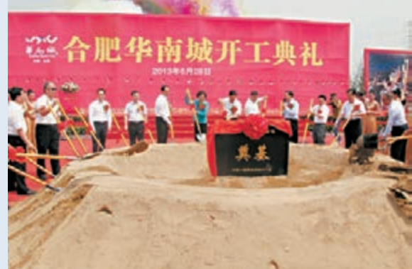
繼去年合肥華南城項目開工後，該公司在當地再有新投資項目。

香港文匯報訊（記者 方楚茵）華南城（1668）昨日宣佈，合肥華南城上週五（18日）從合肥市肥西縣國土資源局成功投得520.89畝土地使用權，總代價2.08億元（人民幣，下同），總規劃建築面積約90.21萬平米。計及去年5月購得總規劃建築面積約394萬平米土地後，合肥華南城成功以總代價12.43億元購得總規劃建築面積約為484萬平方米的土地，將用作發展合肥項目。