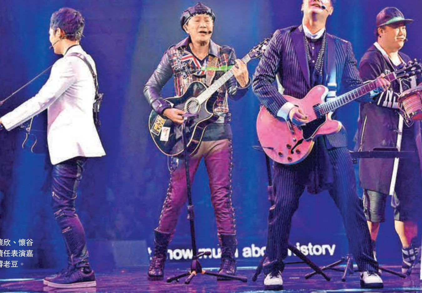
懷欣、懷谷繼續任表演嘉賓撐老豆。