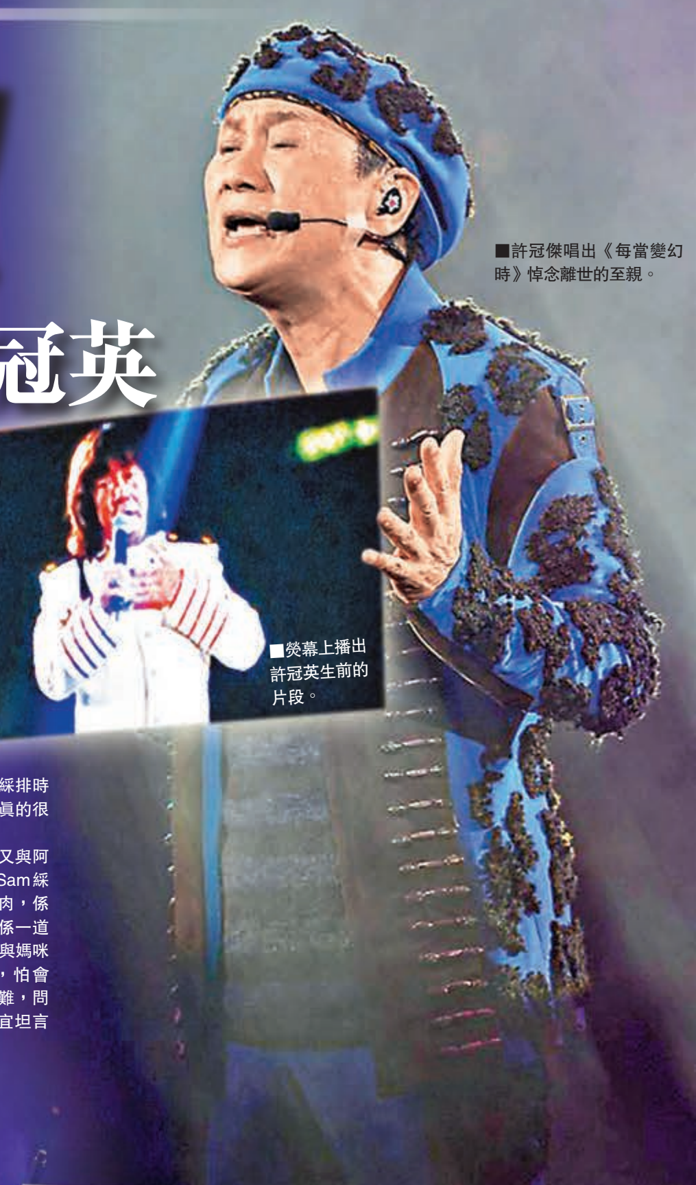
許冠傑唱出《每當變幻時》悼念離世的至親。