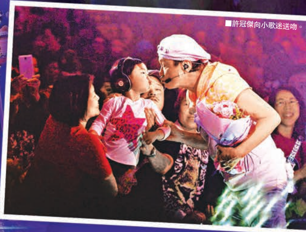
許冠傑向小歌迷送吻。