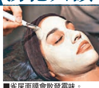
雀屎面膜會散發霉味。