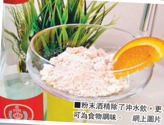
粉末酒精除了沖水飲，更可為食物調味。

Palcohol結合了「Powdered」(粉末)及「Alcohol」(酒精)兩字，酒精濃度因口味而異，一般都超過50%，酒鬼可直接用鼻吸入粉末，保證幾乎即時醉倒。產品廣告以廉價作招徠，「觀看演唱會或球賽，買杯雞尾酒便要10、15甚至20美元。你在說笑嗎？」