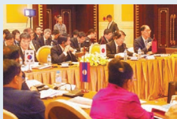
曾德成(右一)於東盟-中日韓(十加三)文化部長會議上發言。

香港文匯報訊（記者 鄭治祖）特區民政事務局長曾德成昨日出席第六屆東南亞國家聯盟-中日韓(十加三)文化部長會議，以及第二屆東盟-中國文化部長會議。他在文化部長會議上發言時表示，香港會爭取與更多亞洲國家簽訂文化合作備忘錄，促進區內文化藝術交流、合作、發展。