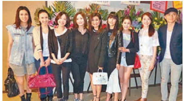
■一班TVB同事前來捧阿田場。