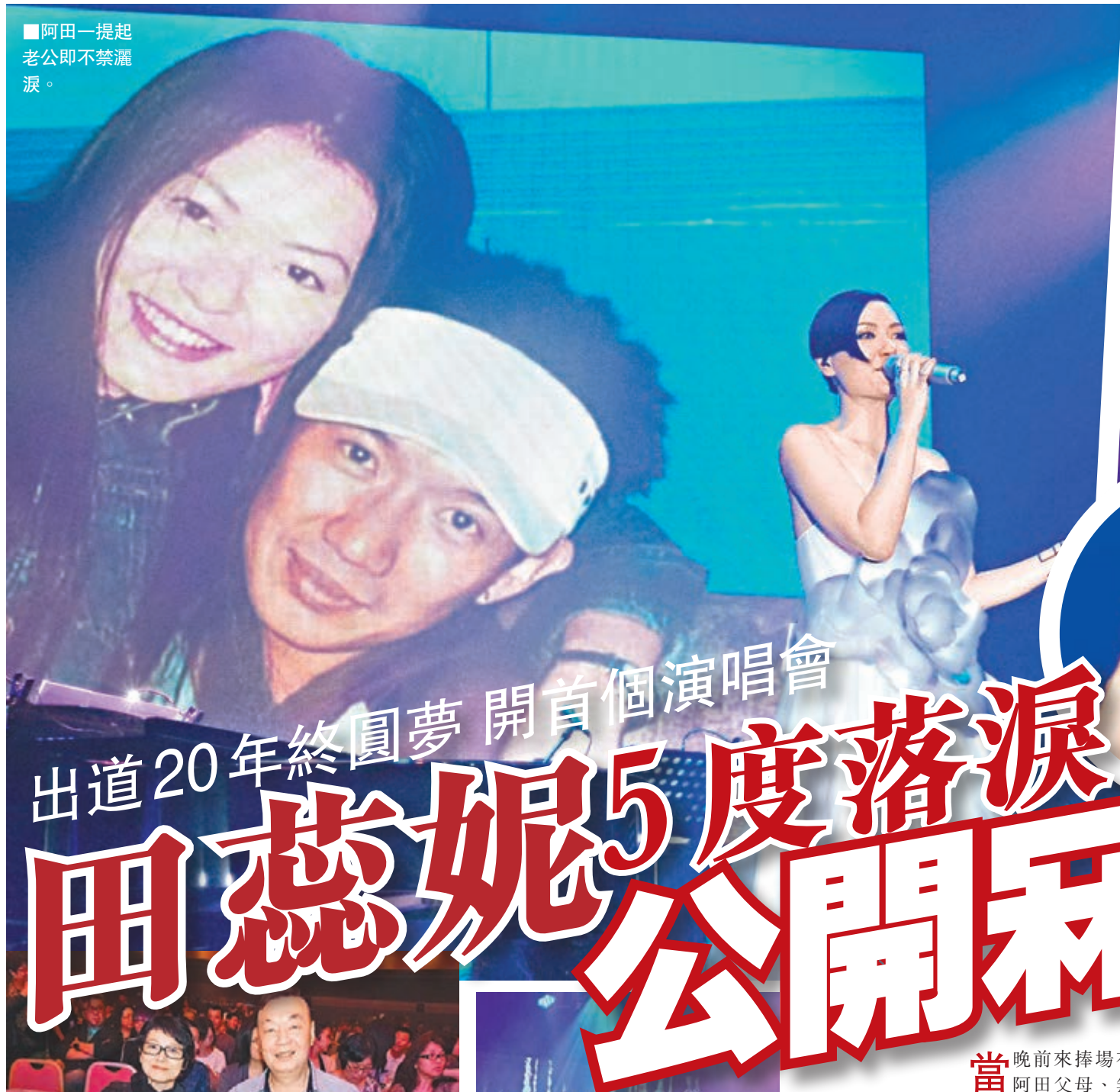
■阿田一提起老公即不禁灑淚。