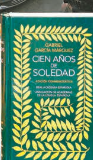
《百年孤寂》 One Hundred Years of Solitude 1967年