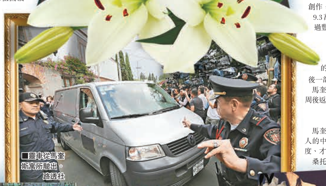
靈柩從馬奎斯寓所駛出。