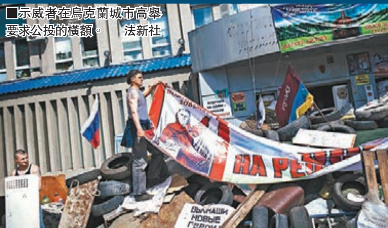
示威者在烏克蘭城市高舉要求公投的橫額。

烏外長傑希察昨警告，若親俄分離分子繼續佔領政府建築物，政府將於下周採取「更具體行動」。圖爾奇諾夫昨稱，新憲法將向地方政府下放權力，並准許各地將俄語列為官方語言。