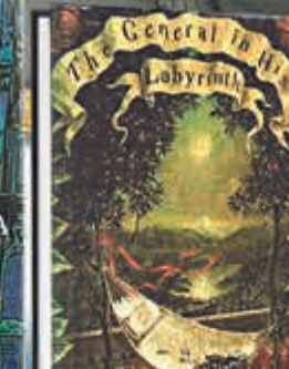
《迷宮中的將軍》 The General in his Labyrinth 1989年