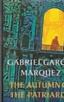
《獨裁者的秋天》 The Autumn of the Patriarch 1975年