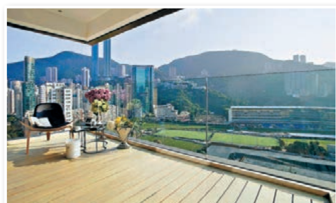
▲ 擁有廣闊露台，前臨廣闊馬場景致的豪宅物業極為珍罕。

雲暉大廈由兩座樓高21層住宅物業組成，提供84個豪華大宅，每層兩梯兩伙，實用面積分別2,006平方呎及1,567平方呎，為四房雙套房連工人套房及三房套房連工人套房大宅設計。兩款間隔不設窗台，客廳均設有對流窗，實用又通爽。為凸顯大宅露台廣闊空間感，全數84個單位皆建有闊逾百呎的大露台，盡擁廣闊馬場及翠綠山景，夜幕降臨更可與三五知己歡聚暢飲、遠眺銅鑼灣迷人夜景，極具奢華氣派。