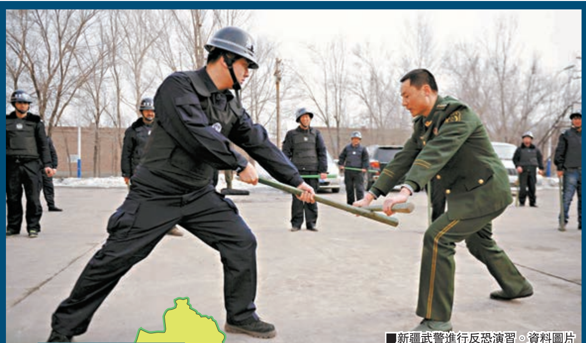
■新疆武警進行反恐演習。資料圖片

在今年2月14日下午4時許,一名嫌犯駕車攜帶爆炸裝置,手持砍刀,襲擊阿克蘇地區烏什縣公安巡邏車輛,致2名民眾和2名民警受傷,5輛執勤車損毀。公安民警在處置過程中,擊斃8人,抓獲1人。另有3名嫌犯在實施犯罪時發生自爆死亡。