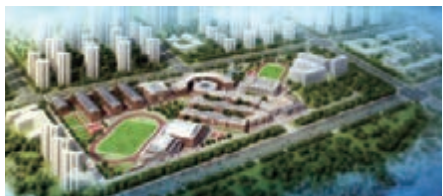
■天津市南開中學濱海生態城學校鳥瞰圖。

香港文匯報訊 據《濱海時報》報道,作為濱海新區十大民生工程項目之一,天津實驗中學濱海學校項目,基礎施工已進入尾聲。今年4月底,該工程將正式進入樓層主體施工階段。 據悉,濱海新區外來人口以每年30%的速度增長,目前新區248萬人口中,流動人口過半。目前,濱海已接收外來務工人員子女3.1萬多人,佔全區中小學生總數的28.6%。