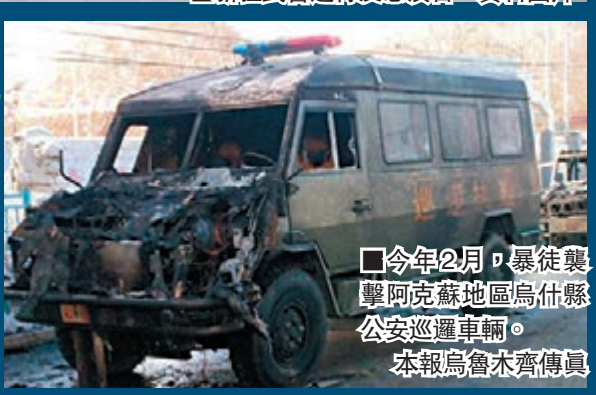
■今年2月,暴徒襲擊阿克蘇地區烏什縣公安巡邏車輛。本報烏魯木齊傳真