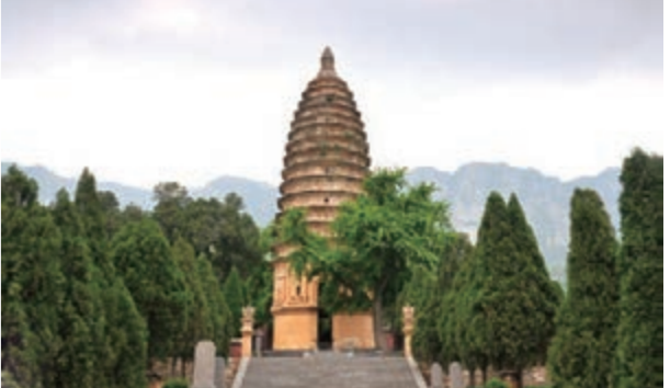
■登封「天地之中」歷史建築群——嵩嶽寺塔。