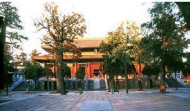
■登封「天地之中」歷史建築群——中嶽廟峻極殿。

提起少林寺，不能不說的是少林功夫。少林功夫是漢族武術中體系最龐大的門派，武功套路高達七百種以上，少林功夫中的武，已經融匯在了參禪之中。這是少林功夫與其他派系武術的不同之處。禪與武的優越之處，就是少林功夫已經形成人可以演練的很具體的參禪程式。提倡武術禪的真正價值，就是為人們提供了一個有效的參禪程式。因此少林功夫又有「武術禪」之稱。