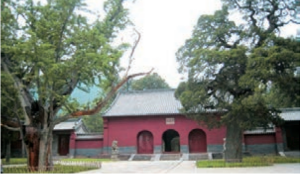
■登封「天地之中」歷史建築群——會善寺。