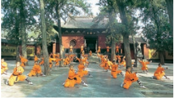
■登封「天地之中」歷史建築群——少林寺。