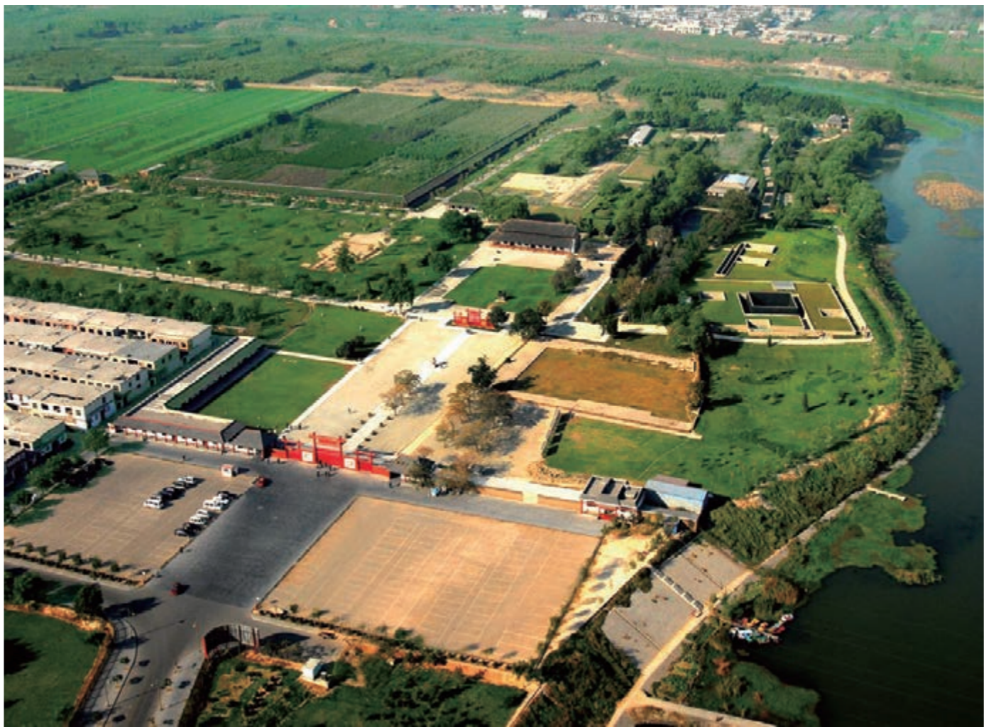
■殷墟宮殿宗廟遺址鳥瞰。

力，同時形成了自己獨特的藝術風格。它以圓雕、俏色、雙勾陰線為主要技法，表現出栩栩如生的人或動物形象。其獨特的琢玉技術，在世界上處於領先地位。特別是以婦好墓玉器為代表的作品，造型生動，刻畫細膩，工藝精湛，堪稱世界玉雕藝術中的精華。