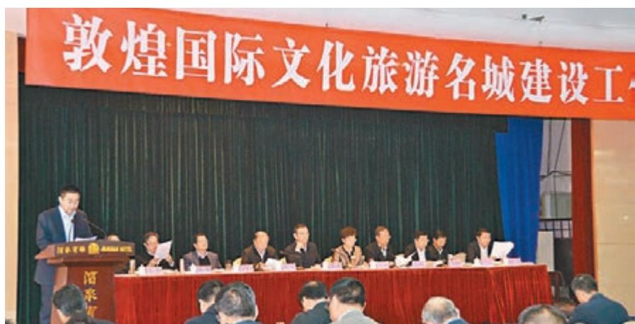
敦煌國際文化旅游名城建設工作會議現場。

香港文匯報訊(記者 王岳 酒泉報導)敦煌擁有世界級的文化資源,既是古絲綢之路的重要樞紐城市,也是絲綢之路經濟帶甘肅段的重要節點城市,是甘肅省對外交流的一張名片。中共甘肅省委常委、宣傳部部長連輯日前於「敦煌國際文化旅游名城建設工作會議」表示,甘肅將以敦煌文化遺產和自然遺產保護為前提,融合綠洲經濟科學發展新模式,將敦煌市五萬畝建設用地按照打造「田園城市」的理念規劃,建設未來的敦煌市,構建國家文化向西開放的平台,實現敦煌文化的現代復興。包括建設藝術家文化園、漢唐古鎮及飛天科技博覽園等,貫徹「不動的是田園,變動的是建築」。