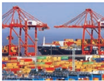
寧波港1季度迎開門紅。