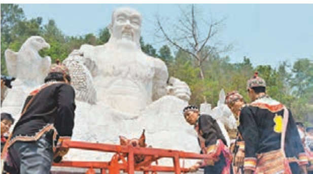
雲南祭茶祖 15日人們在祭祀神農氏,當日「古茶之鄉」雲南省雙江拉祜族佤族布朗族傣族自治縣在布朗山舉行祭祀茶祖活動,當地茶農向神農氏敬獻祭品,祈願風調雨順、茶葉豐收。