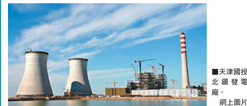
天津國投北疆發電廠。網上圖片

排污費新規的出台,已使一些「污染大戶」被迫採取行動。位於濱海新區的天津國投北疆發電廠,目前已經啟動實施燃機組環保升級。改造之後,這座大型發電廠將實現大幅減排。該發電廠相關負責人表示7月1日以後,如果保持現狀,每年的排污費要超過五千萬,所以必須加大技改力度。