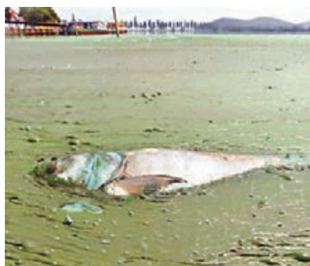
內地過度排污損害生態。

著名環境法學專家、中國政法大學教授曹明德表示,設立環保警察,將環保執法力量納入司法體系後,其自身的權威性和對污染企業的威懾力將大大增強,對環境違法犯罪行為的打擊力度也將加大。據悉,成都將參照森林公安模式,全市建立環保警察隊伍;今年市環保局配合市公安局、市委編辦完成確定對環保警察編制、機構設置、職能職責、人員配備的相關工作。而河北自去年9月成立環保警察,到年底已刑拘300多名惡意排污嫌疑人,相關人士表示,此舉對治污「非常有用」。