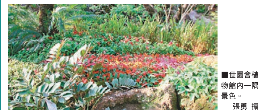
世園會植物館內一隅景色。

本月5號起青島世園會已進行6天的載人試營運,組織普通市民入園進行壓力測試。試運行期間,園區的停車場、接駁車輛、餐飲設施、廁所、園區廣播設施等將陸續開放,邀青島市民持票入園。據估算,世園會期間客流總規模預計將達到1600萬—1800萬人次,平均每天的遊客數量為七八萬左右。試營運期間,世園會每天的人園人數在三萬人左右,未來一段時間會逐步提升數量以迎接開園高峰的到來。本屆世園會的開放時間為4月25日至10月25日,共計184天世園會展期結束後會保留部分場館,也將作為開放平台面向大眾,幫助青島旅遊由觀光旅遊向休閒度假旅遊轉變。