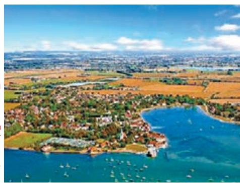
長春卡倫是美麗鄉村試點之一。

香港文匯報訊(記者 蘇志堅 長春報導)今年長春市重點建設100個美麗鄉村示範村(省級71個,市級29個),加大投入力度,全面完成「兩改四化」的工作目標。「兩改」為改水、改廁。100個示範村要全部達到飲水安全標準,基本完成衛生廁所改造任務。「四化」為硬化、淨化、綠化、美化。