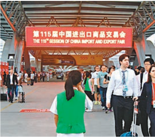
■廣交會首日，出口企業反映客流未有回溫。