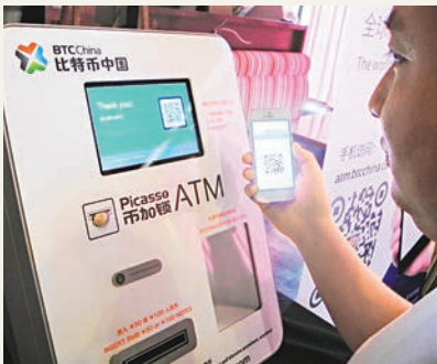
■比特幣中國投放境內首部比特幣ATM。

香港文匯報訊（記者 章蘿蘭 上海報道）去年風生水起的比特幣今春因政策打壓遭遇重創。比特幣中國首席執行官李啟元昨指，目前中國境內比特幣交易量已經萎縮80%，面臨寒冬。為吸引新的交易人群，比特幣中國在浦東張江一咖啡廳內最新投放了境內首台比特幣ATM，以及全球首款用於移動終端的軟件移動比特幣售賣機「幣加鎖ATM」。