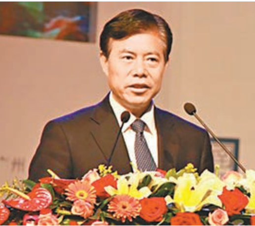
■鍾山指中國外貿仍具綜合競爭實力。

朱小丹又稱，李克強總理此前出席國家經濟形勢分析會時表示，對於廣東，商務部等已在研究，廣東自己能拿出來的政策先拿出來，將來再向國家爭取。他相信廣東浙江上海等出口大戶，要單獨拿些政策來扶持。他亦呼籲企業藉目前難關轉型升級，這個時候更需要港澳一起面對這個困難。