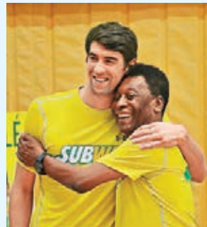
早前菲比斯會晤比利，是否已成前者邁向巴西的暗示？

「菲魚」的教練鮑曼接受美國傳媒採訪時，指這位京奧8金王將參加50米自由泳、100米自由泳及100米蝶泳3項比賽，亦透露菲比斯現仍未屆其最佳水平。鮑曼說：「我覺得他的想法，是先下水試試自己狀態，且看情況如何。我認為這並非一次完全準備