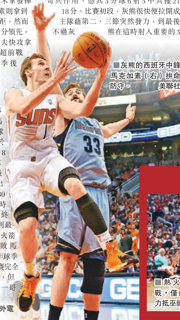
灰熊的西班牙中鋒馬克加索(右)拚命防守。