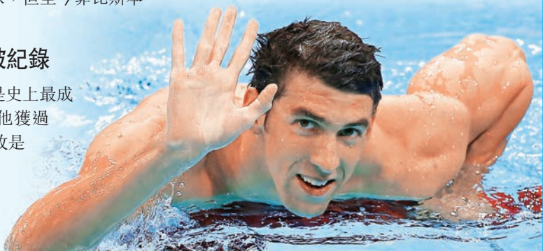
菲比斯正式復出，瞄準2016年奧運會。