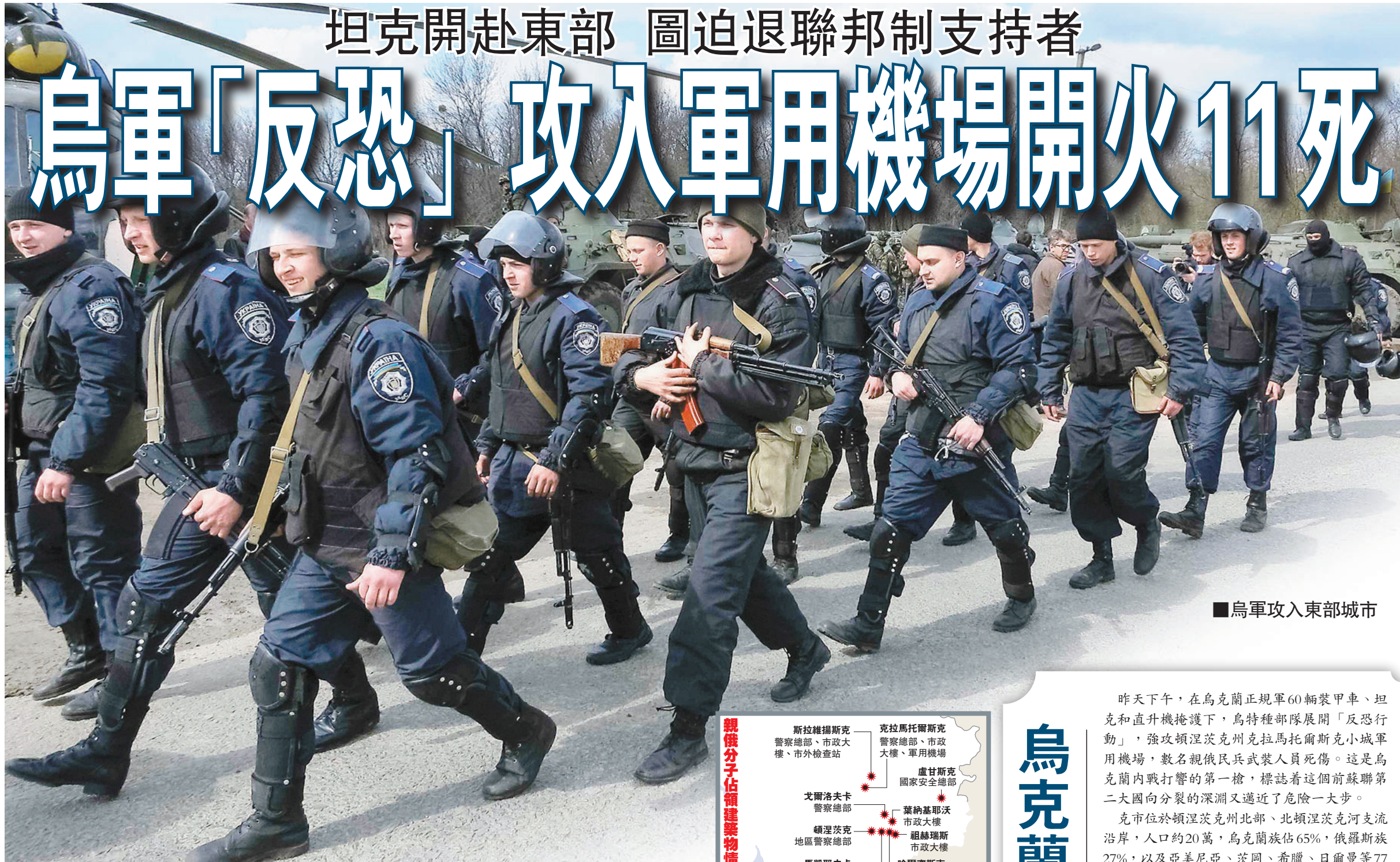
烏軍攻入東部城市

烏克蘭問題四方會談將於明日在瑞士日內瓦舉行，但烏國局勢昨日急劇升溫，內戰瀕臨爆發。俄媒報道，烏國軍隊採取「反恐」行動，向被親俄民兵武裝分子佔領的克拉馬托爾斯克市軍用機場發動攻擊，造成4至11死多人傷，民兵組織被迫撤退，代總統圖爾奇諾夫稱烏軍已奪回機場控制權。另外，烏軍亦計劃攻入東部城市斯拉維揚斯克，從聯邦制支持者手上奪回控制權。