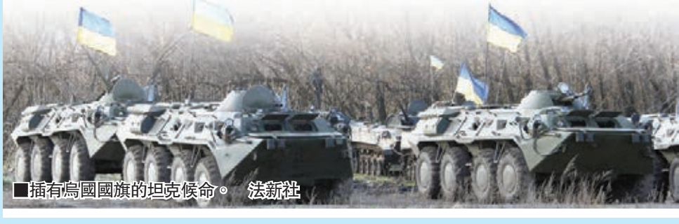
插有烏國旗的坦克候命。

歐盟又通過兩項支持烏克蘭經濟、金融改革的援助方案，包括向烏提供10億歐元(約107億港元)的宏觀金融支持，還批准對烏的貿易優惠措施，由本月底起對從烏進口的大部分工業品和所有農產品實施關稅減免。