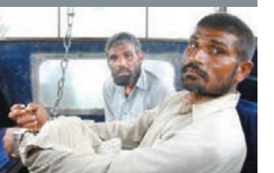
二人曾在2011年被捕。