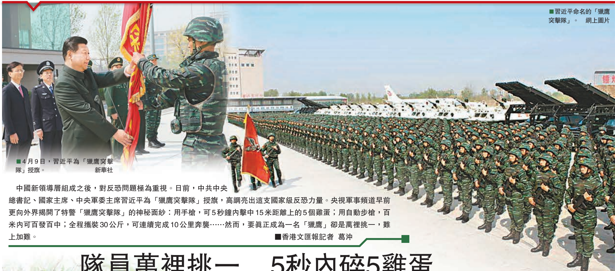
■4月9日，習近平為「獵鷹突擊隊」授旗。

中國新領導層組成之後，對反恐問題極為重視。日前，中共中央總書記、國家主席、中央軍委主席習近平為「獵鷹突擊隊」授旗，高調亮出這支國家級反恐力量。央視軍事頻道早前更向外界揭開了特警「獵鷹突擊隊」的神秘面紗：用手槍，可5秒鐘內擊中15米距離上的5個雞蛋；用自動步槍，百米內可百發百中；全程攜裝30公斤，可連續完成10公里奔襲……然而，要真正成為一名「獵鷹」卻是萬裡挑一，難上加難。