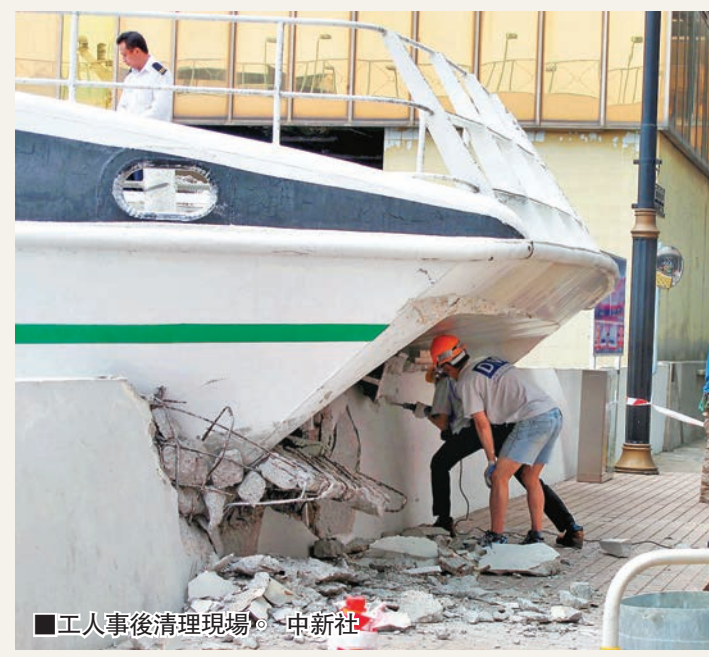
工人事後清理現場。