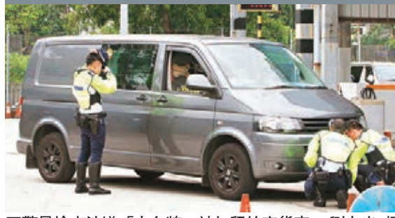
警員檢查涉嫌「走白牌」被扣留的客貨車。

香港文匯報訊(記者 劉友光、杜法祖)警方續打擊「白牌車」活動,前日開始一連2日,分別在港九及新界「放蛇」,至少拘捕4名違例司機。前日下午4時半,港島總區交通部特遣隊派出警員