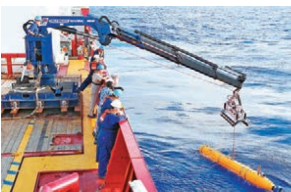
■美國「藍鱈金槍魚-21」自主式水下航行器昨日下午展開搜尋行動。

搜救協調中心稱，15日晚些時候，如果天氣狀況允許，「藍鱈金槍魚-21」將再次被部署下水。