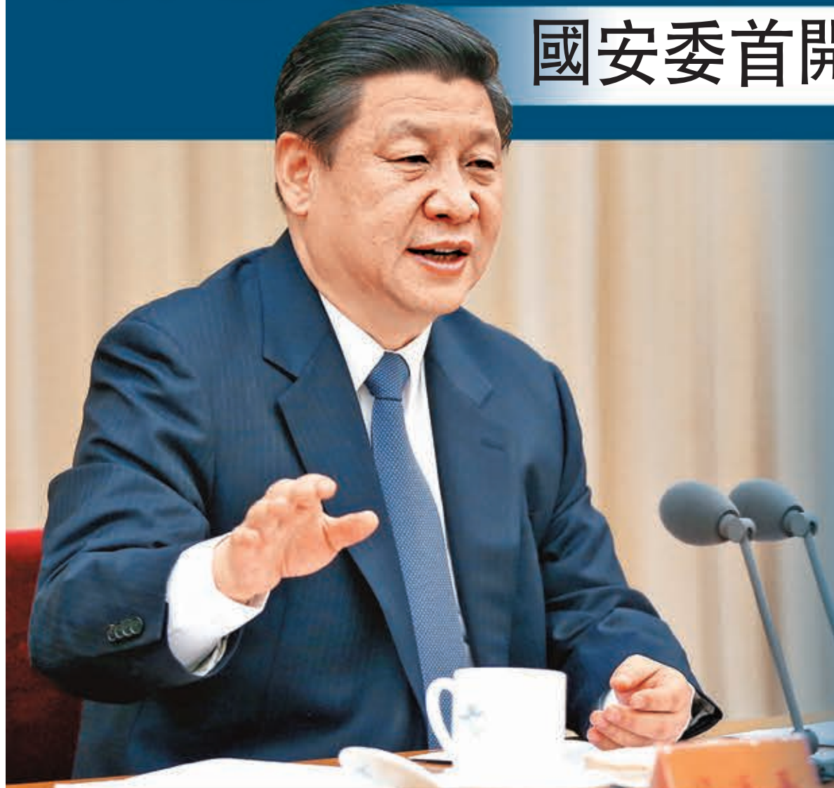
■習近平昨日主持召开國安委首次會議，提出總體國家安全觀。