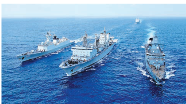
馬航客機搜尋未果，海軍取消「西太平洋海軍論壇」舉行閱兵活動。圖為海軍艦隊。

自從2012年9月日本政府非法「購買」釣魚島以來，中日高層官方聯繫已經斷絕。中日海軍首腦上一次會談就是