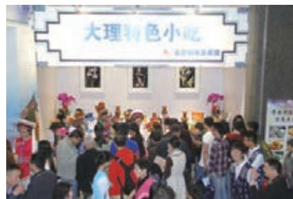
美味的大理小吃也搬到了京城。