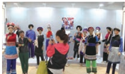
大理白族服飾樣式多、色彩豔麗，觀眾抓住機會合影留念。