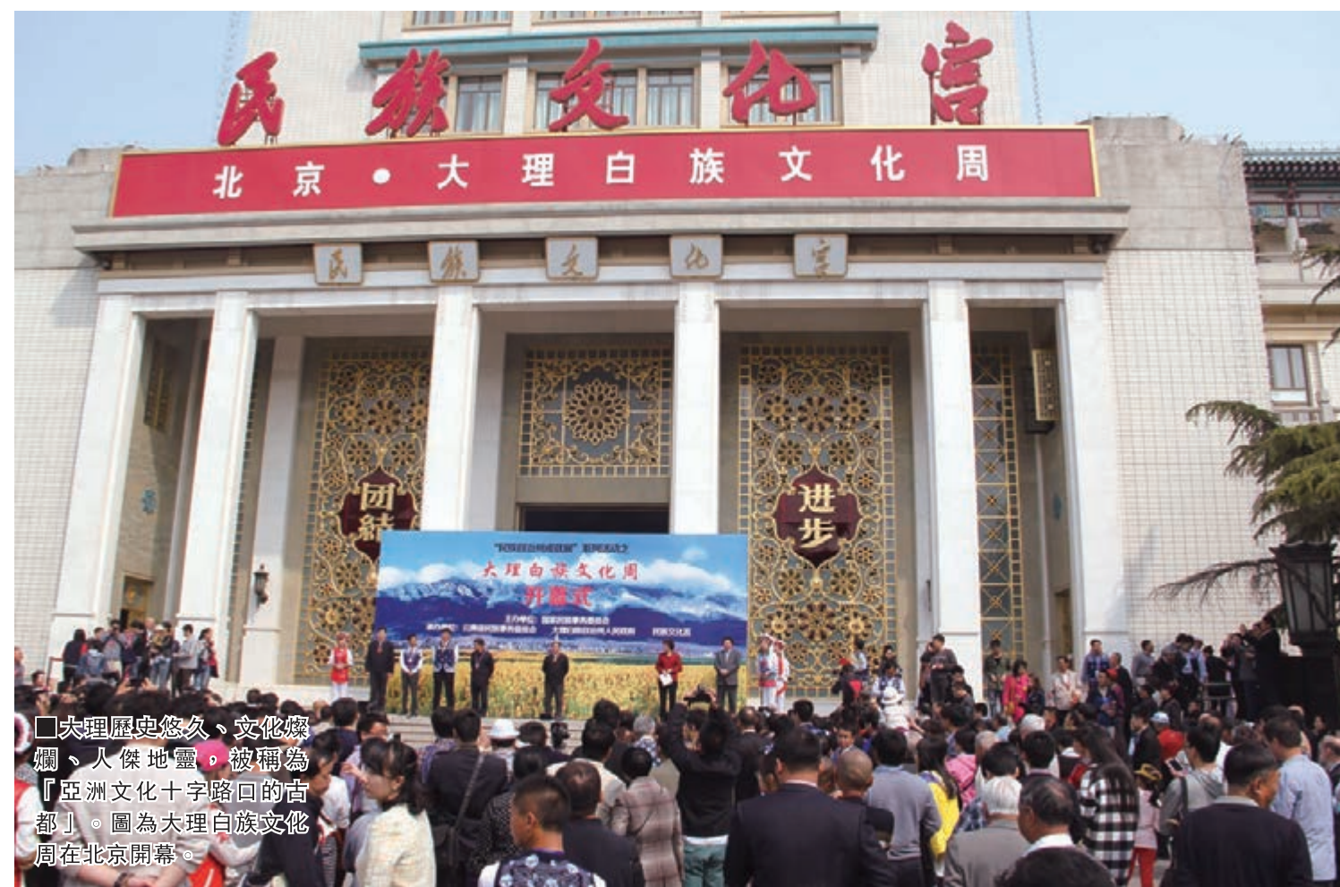
大理歷史悠久、文化燦爛、人傑地靈，被稱為「亞洲文化十字路口的古都」。圖為大理白族文化周在北京開幕。