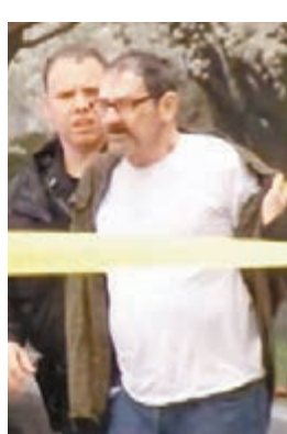
槍手被捕。 網上圖片

在猶太人傳統節日逾越節前夕，美國堪薩斯州堪薩斯城郊區一個猶太人社區前日發生連環槍擊案，導致3人死亡，槍手被捕後更高呼「希特勒萬歲」。當地反仇恨組織稱，疑兇是反猶太分子的