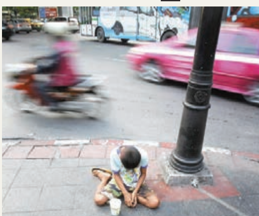
2010年有9.52億人日賺約23港元，隨時跌回貧窮線下。圖為曼谷乞丐。

不少人雖已脫貧，但2010年有9.52億人日賺僅2至3美元(約23港元)，隨時可能跌回貧窮線下。世銀首席經濟師巴蘇指出，全球經濟面對危機，