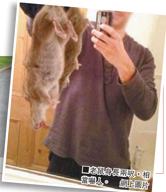
老鼠身長兩呎，相當嚇人。 網上圖片