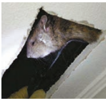
出身鄉郊的老鼠現已「移居」城市。

惠蘭表示，最近經常出沒的老鼠出身鄉郊，現已「移居」城市。他呼籲歐盟准許英國使用更強的第三代老鼠藥，紓緩鼠患。然而環保組織擔心新藥太強會傷害人類及大自然。