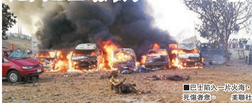
巴士陷入一片火海，死傷者眾。

尼日利亞首都阿布賈郊區一個巴士站昨日發生炸彈爆炸，造成71人死亡、124人受傷，是阿布賈周邊地區兩年來首次受襲。目前未有組織承認責任。總統喬納森巡視現場時，指伊斯蘭極端組織「博科聖地」策動襲擊。隨着明年大選臨近，當地近期襲擊事件頻生，局勢動盪。