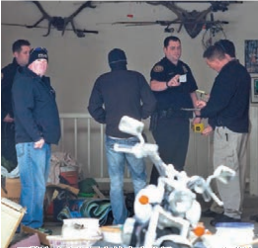
警方在亨斯曼家的車庫蒐證。

鄰居聞訊大感震驚。一人表示，亨斯曼待人友善，有時會請她幫忙照顧孫兒，不敢相信她會親手殺死7名嬰兒。也有人指她近年忽胖忽瘦，但沒懷孕跡象，連與她同住的3名13至20歲女兒似乎也不知車庫藏有嬰兒。