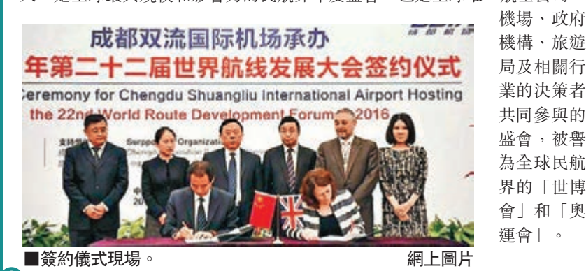
簽約儀式現場。

香港文匯報訊（記者 劉銳 成都報導）近日記者獲悉，成都雙流國際機場成功獲得了2016年第22屆世界航線發展大會的承辦權。這是中國第二家機場成功取得該會承辦權，首次為2009年北京首都機場。世界航線發展大會始於1995年，由英國博聞集團主辦，參會規模約3500人，是全球最具規模和影響力的民航界年度盛會，也是全球唯一航空公司、機場、政府機構、旅遊局及相關行業的決策者共同參與的盛會，被譽為全球民航界的「世博會」和「奧運會」。