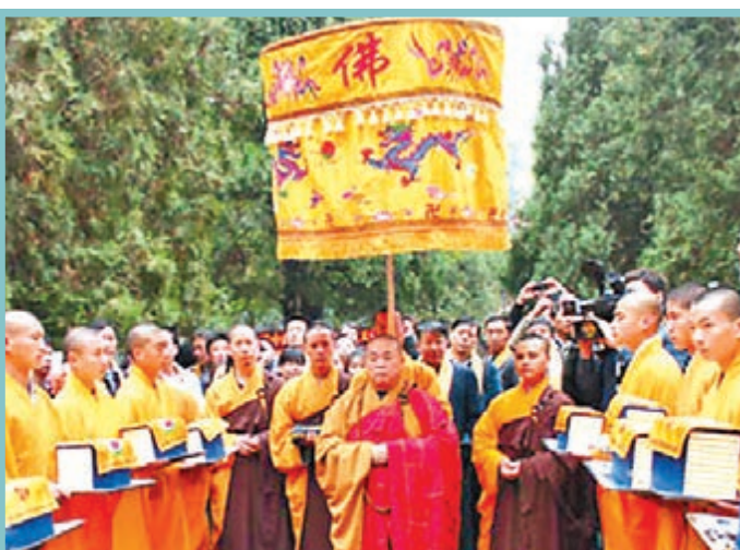
河南少林寺迎完整大藏經

香港文匯報訊（記者 趙臣、通訊員 趙無名 合肥報導）日前政府正式發布政策文件，根據該政策文件，合肥市將嚴控在生態保護區內進行與生態保護無關的開發建設活動。文件表示將從嚴控制生態保護區內進行與生態保護無關的開發建設活動。同時，將限制該市環巢湖流域房地產開發項目和工業項目建設，並支持該市巢湖流域各鄉鎮建設污水處理設施。此外該政策文件還在土地出讓方面明確了很多禁區。如嚴禁土地出讓與BT、BOT等建設項目捆綁等。