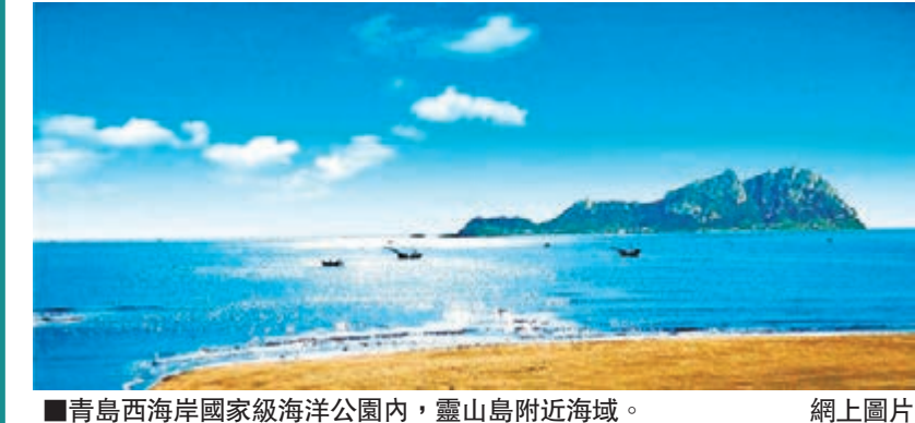
青島西海岸國家級海洋公園內，靈山島附近海域。

香港文匯報訊（記者 許桂麗、王宇軒 青島報導）近日，中國國家海洋局審議通過了11個國家級海洋特別保護區（海洋公園），青島西海岸國家級海洋公園名列其中。這是青島市獲得批准建立的首個國家級海洋公園。據有關調查，該公園區域內的海水水質和海域沉積物環境質量總體較好，海域的浮游植物種類大約有163種，浮游動物種類約32種。除了豐富的海洋生物資源，還有成熟的旅遊、港口航運、海洋科研、礦產。金沙灘、銀沙灘、唐島灣、風河入海口濕地、靈山島、琅琊台、齊堂島等風景景觀頗具規模，小珠山、鐵嶺山、藏馬山和大珠山則構成了東北——西南向生態走廊，森林覆蓋率達44.2%，具備建設生態文明的獨特優勢。青島西海岸國家級海洋公園由東區、西區兩部分組成，總面積為45855.35公頃。