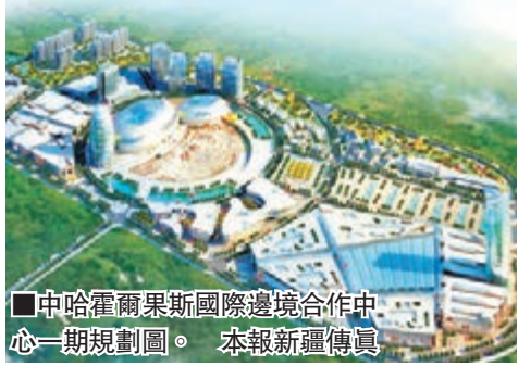
中哈霍爾果斯國際邊境合作中心一期規劃圖。本報新疆傳真

香港文匯報訊（記者 王辛鵬 新疆報導）新疆霍爾果斯經濟開發區日前推出了今後3年的發展思路和12項重點舉措，總體目標是將霍爾果斯經濟開發區打造成「新絲路之路經濟帶」的重要支點、中國向西開放的重要窗口以及西部地區重要的對外開放門戶城市，真正成為「國際物流港、國際金融港、國際信息港、國際旅遊谷」的先行區。