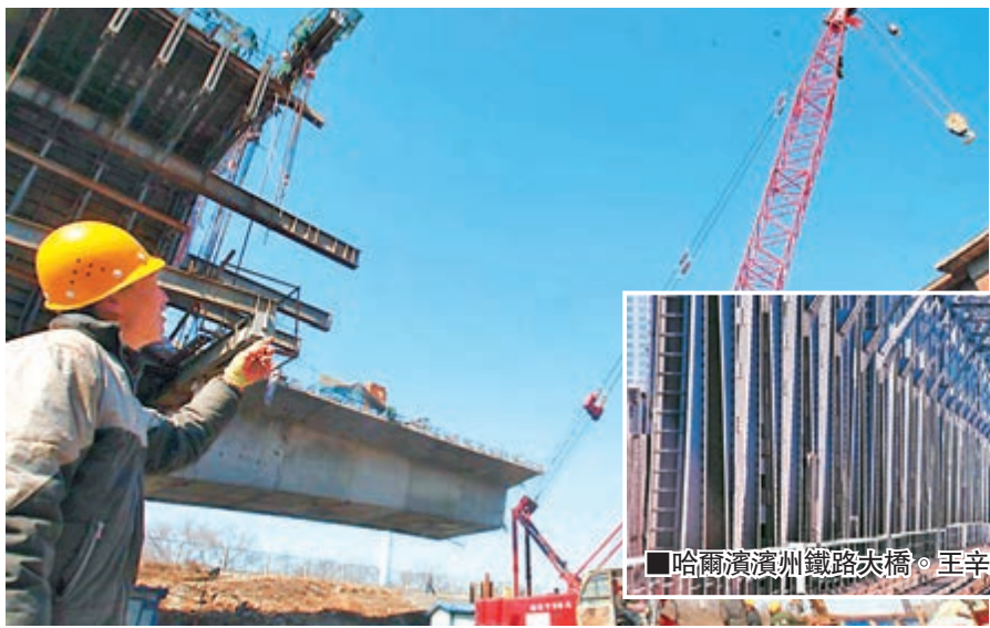
哈齊客運專線松花江特大橋施工現場。

香港文匯報訊（記者 孫菲 哈爾濱報導）國內首創整體四線剛性繫桿拱橋——哈齊客運專線松花江特大橋，日前正在如期施工當中。該大橋將容納4趟鐵路線，行駛目前國內緯度最高的高寒鐵路客運專線。而擁有百年歷史的濱洲鐵路大橋已暫停使用。