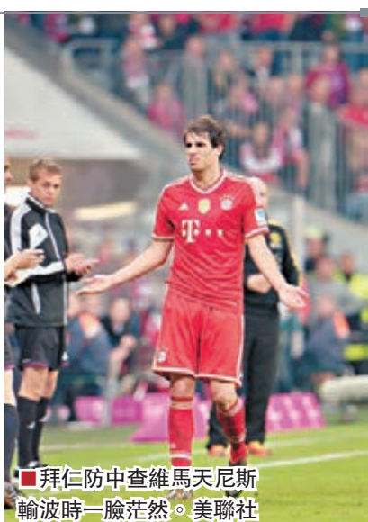
拜仁防中查維馬天尼斯輸波時一臉茫然。