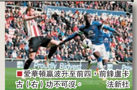
愛華頓贏波升至前四，前鋒盧卡古(右)功不可沒。