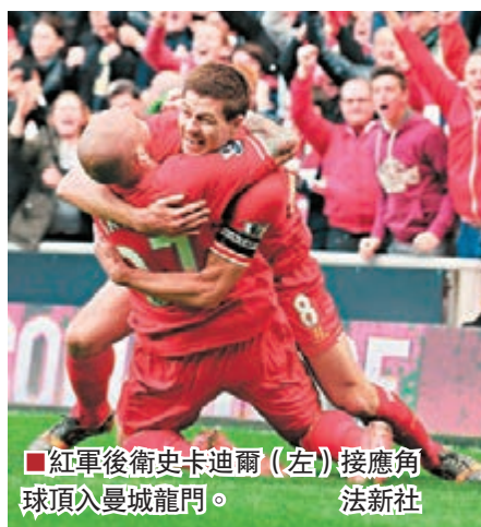
紅軍後衛史卡迪爾(左)接應角球頂入曼城龍門。