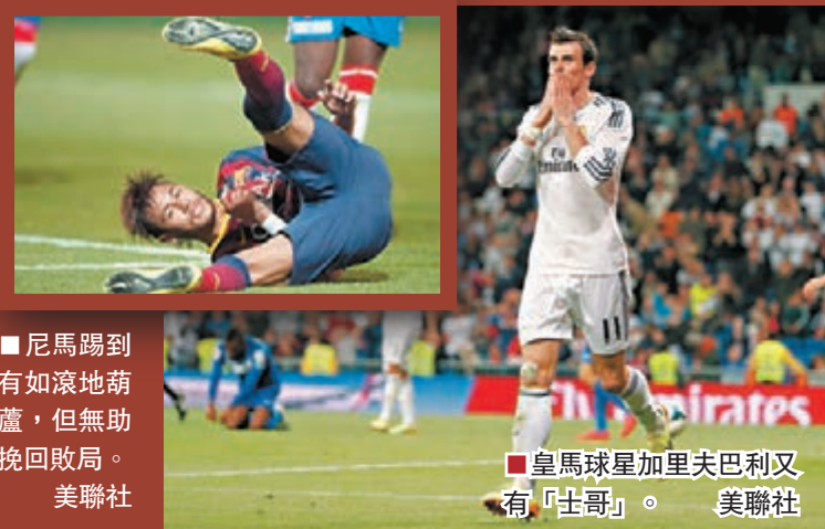
皇馬球星加里夫巴利又有「士哥」。