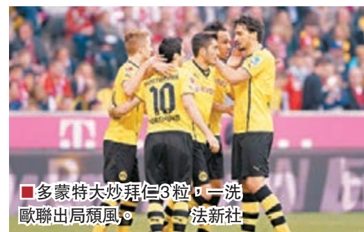
多蒙特大炒拜仁3粒，一洗歐聯出局頹風。

雖然今屆德甲冠軍上月底已成拜仁慕尼黑的囊中物，但同屬強隊的多蒙特未有放軟手腳，昨日凌晨作客以3：0擊敗拜仁，一報首循環以相同比數報復