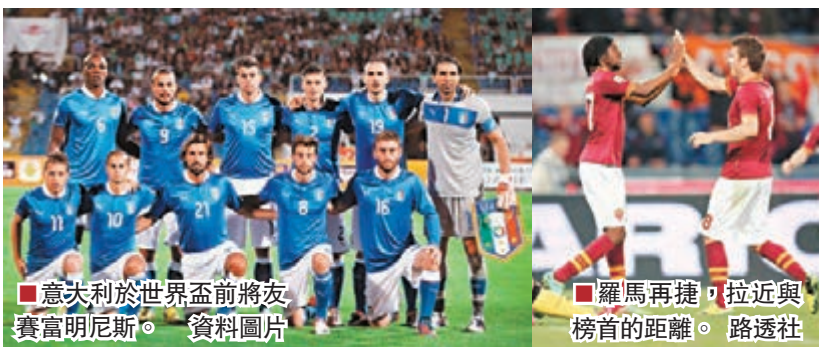
意大利於世界盃前將友賽富明尼斯。