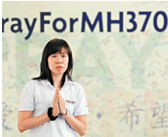
▲吉隆坡一名市民昨日正在祈禱，希望馬航MH370早日尋回。

香港文匯報訊 阿博特總理接受央視採訪時表示，或將為失蹤馬航的受害者舉辦追思儀式建造紀念碑。當被問及澳洲對受害者家屬有什麼承諾時，阿博特表示，澳洲歡迎受害者家屬來，無論何時，只要他們願意來澳洲，澳洲將張開雙臂擁抱他們。而且，在受害者家屬和有關政府同意下，澳洲願意為他們舉辦追思紀念儀式，並建造紀念碑。當然，最終確定之前，澳洲需要諮詢家屬和有關政府的意見。