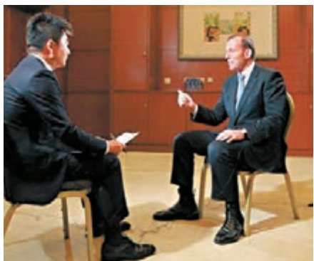
▲阿博特(右)接受央視採訪。

阿博特在接受央視採訪時表示，目前正在海面開展搜索工作，搜索範圍仍然是50公里×40公里，搜尋可能存在的殘骸，採取了投放聲吶浮標的模式。