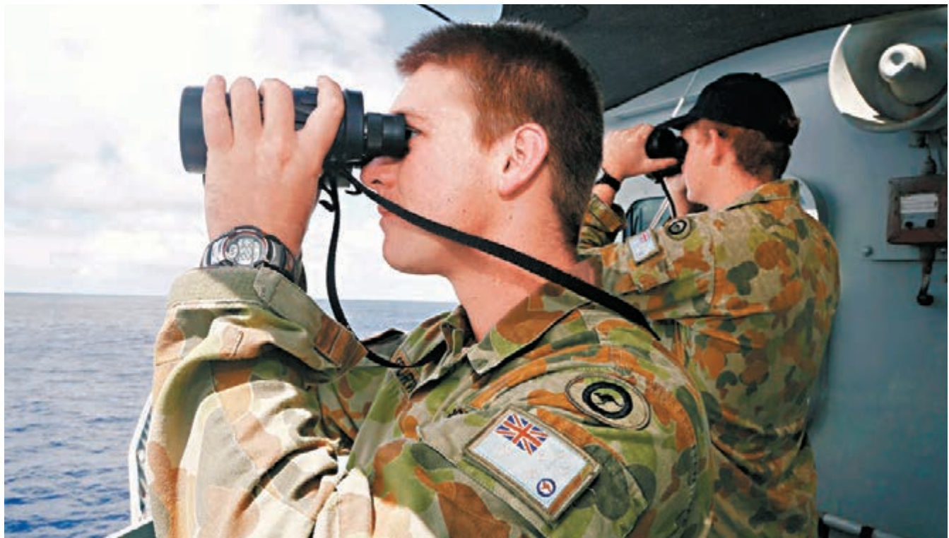
▲澳洲總理阿博特接受央視採訪時表示，希望可將海底搜尋範圍盡可能縮小至1平方公里。

香港文匯報訊（綜合記者田一涵及媒體報道）馬航客機MH370失蹤今天進入第38日，按估計機內俗稱「黑盒」的飛行紀錄儀信號逐漸減弱。不過，澳洲總理阿博特接受央視採訪時表示，希望可將海底搜尋範圍盡可能縮小至1平方公里。阿博特還表示，當黑盒電池完全耗盡時，澳洲將在確定的水下搜尋範圍後派出潛艇開展後續工作，而搜尋工作可能持續「很長的時間」。