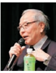
大阪府茨木市市長木本保平。

香港文匯報訊 據日本新聞網報道，日本大阪府茨木市市長木本保平12日在一次集會上否認慰安婦問題存在，他說：「所謂軍隊綁架慰安婦是不存在的事，呼籲否定『河野談話』。」