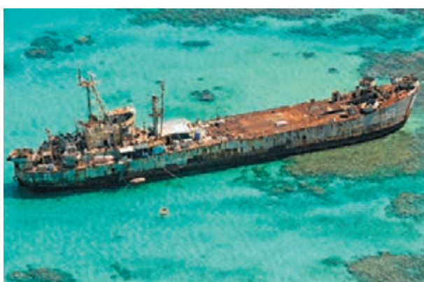
▲在仁愛礁非法坐灘的菲律賓登陸艦。

2013年5月21日，菲律賓「賊喊捉賊」，就中國軍艦「非法」進入南沙群島中的仁愛礁對中方提出抗議；今年3月30日，菲又向聯合國國際海洋法法庭遞交所謂的南海主權仲裁請求，其中包括仁愛礁問題。對此，外交部發言