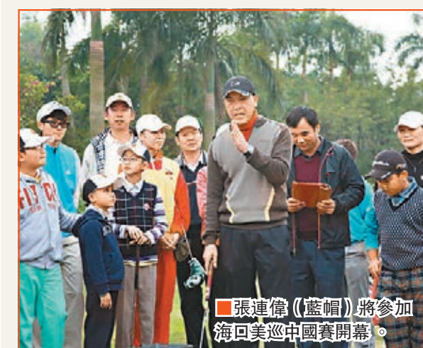
張連偉（藍帽）將參加海回美巡中國賽開幕。