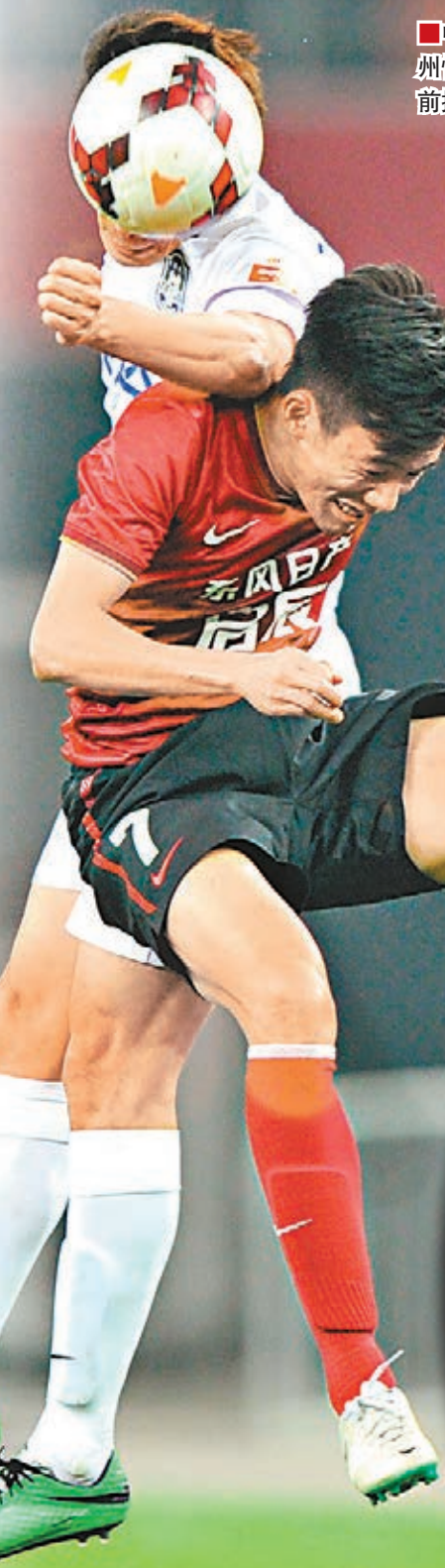
中超衛冕冠軍廣州恒大（紅衫）日前挫天津泰達。