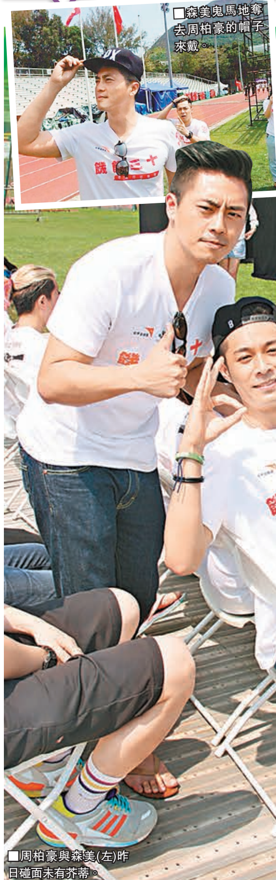
周柏豪與森美(左)昨日碰面未有芥蒂。