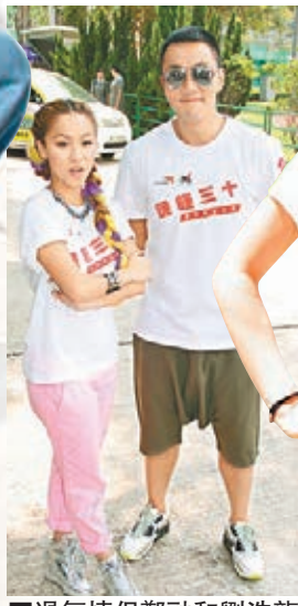
過氣情侶鄭融和劉浩龍出席活動。