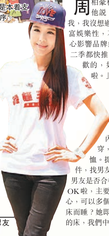
官恩娜日前與男友試同居4天。