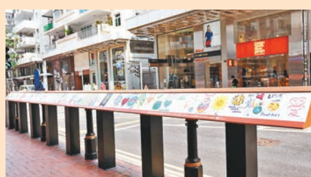
全部畫作會放在銅鑼灣街頭展出。