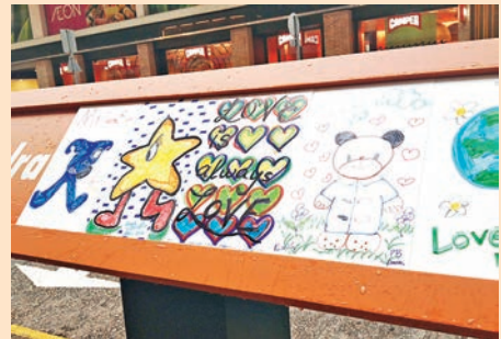
筆者簡單地繪畫了「熊仔與愛」。