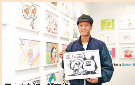
小克創作一幅畫作