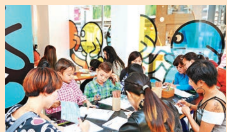
大家齊齊化身「跑手」，繪畫畫作。