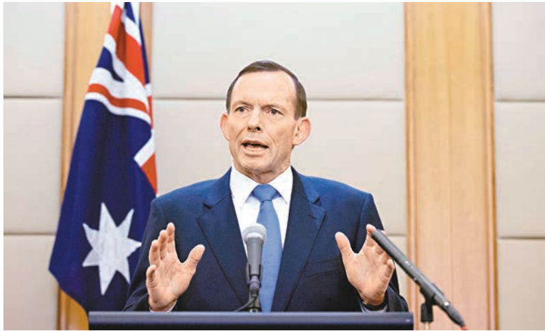
■澳洲總理阿博特昨在北京的記者會表示，他有信心收集到的脈衝信號是來自MH370的黑匣子。

香港文匯報訊（記者 高麗丹 北京報道）澳洲總理阿博特昨日在北京確信，目前搜集到的脈衝信號來自馬航失聯客機上的黑匣子，但是「定位和搜尋仍是一個長期過程。」此外，搜救失聯客機的行動昨日正常進行，中國軍機仍然最早出動。關於搜救的費用問題，阿博特此前曾表示，參與搜尋工作的各國自行承擔己方費用。據悉，中國在搜尋方面的投入約佔搜尋總費用的一半。