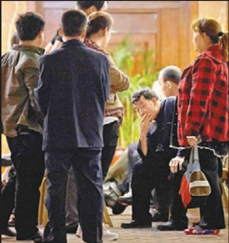
■MH370客機乘客家屬在北京的消息發佈會前，神情憂傷。