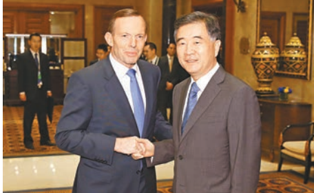
■汪洋與澳洲總理阿博特在北京出席中澳CEO圓桌會中期會議。

香港文匯報訊 中新社報道，中國國務院副總理汪洋和澳洲總理阿博特昨日在北京共同會見參加中澳工商界CEO圓桌中期會議的雙方企業家。汪洋表示，在中澳兩國政府和企業家的共同努力下，雙方經貿合作取得了顯著成績。中國是澳洲第一大貿易夥伴和第一大出口市場，澳洲成為中國企業最大的海外投資目的國。中澳兩國自然稟賦不同，發展階段不同，經濟互補性很強。只要雙方擴大市場開放，拓寬合作領域，創新合作方式，兩國互利合作的蛋糕一定會越做越大。