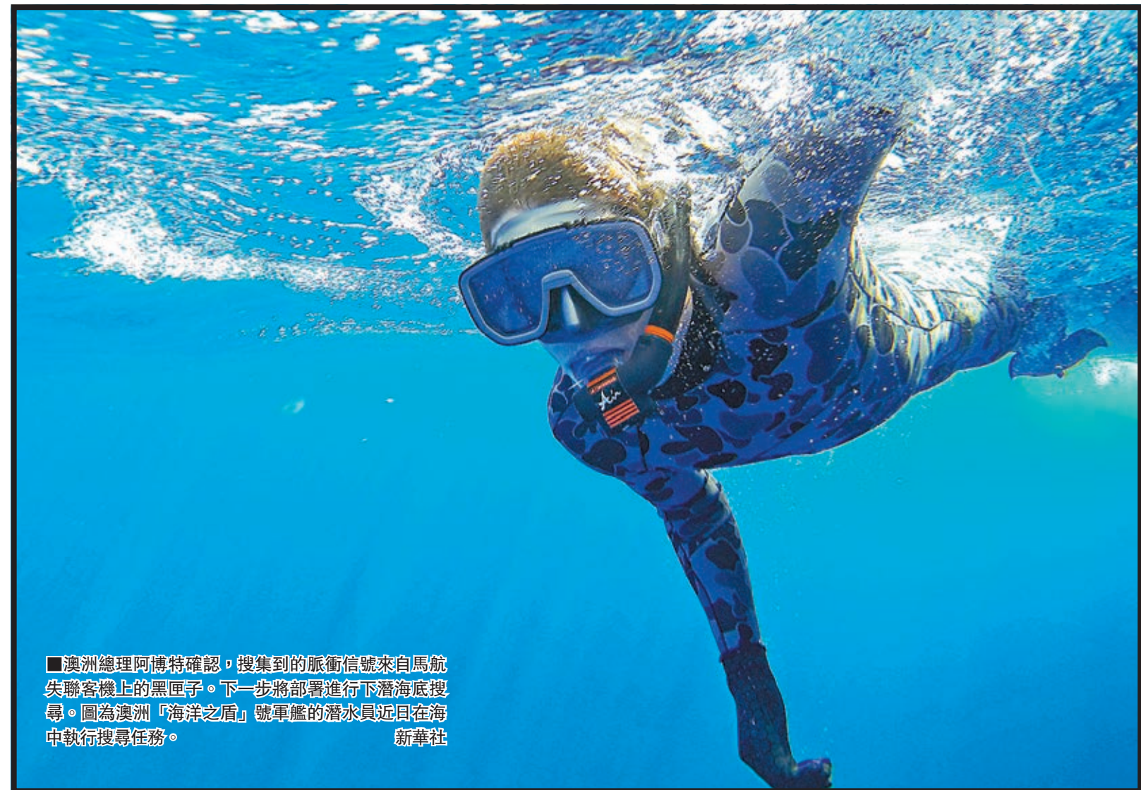
■澳洲總理阿博特確認，搜集到的脈衝信號來自馬航失聯客機上的黑匣子。下一步將部署進行下潛海底搜尋。圖為澳洲「海洋之盾」號軍艦的潛水員近日在海中執行搜尋任務。