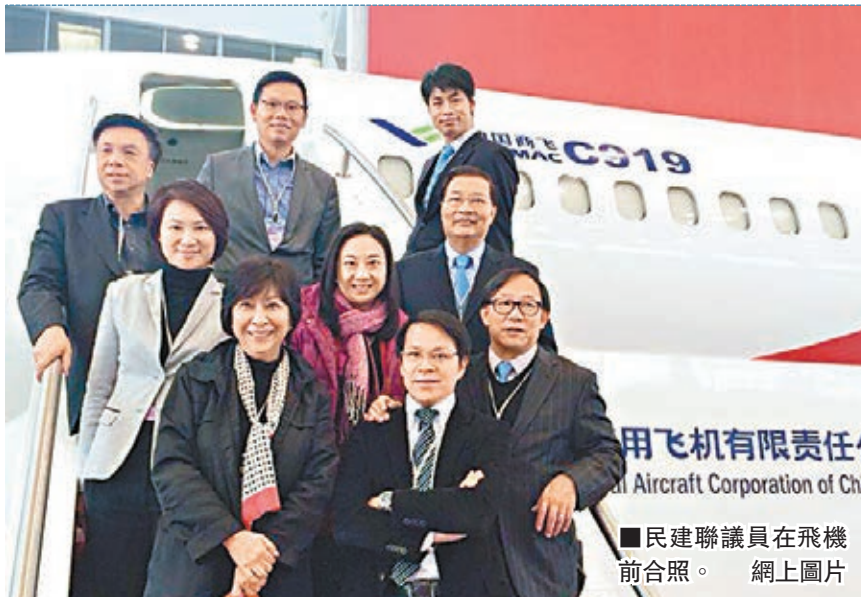
■民建聯議員在飛機前合照。網上圖片

香港文匯報訊（記者 鄭治祖 上海報道）千里之行，始於足下。由立法會主席曾鈺成昨日率領50多名議員正式展開為期兩日的訪問行程。行程首日，訪問團先後訪問上海虹橋商務區，綜合機場鐵路交匯處等多個重要發展項目。議員在視察後均讚嘆，闊別上海數年，發現當地基礎設施竟如此急速發展。他們希望香港汲取經驗，不要將精力消耗在政治紛爭上，而是抓緊機遇，和內地各省市加強合作，達至互利共贏。