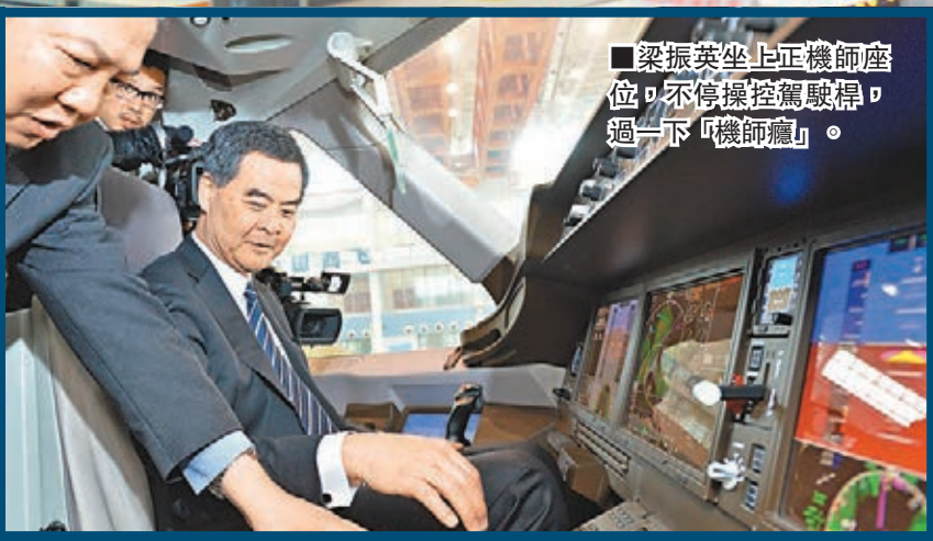
■梁振英坐上正機師座位，不停操控駕駛桿，過一下「機師癮」。

香港文匯報訊（記者 鄭治祖 上海報道）飛機師熱潮近年席捲香江，連特首梁振英也想一嚐「揸飛機」的滋味？立法會訪滬團昨晨「連踩三場」，考察虹橋商務區及交通樞紐後，最後一站是正在製造中國第一架自製幹線客機的中國商用飛機有限責任公司，在參觀的同時也過了一下「機師癮」。