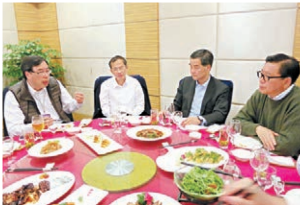
■梁振英在夜宴中認真聽取議員意見。鄭治祖 攝