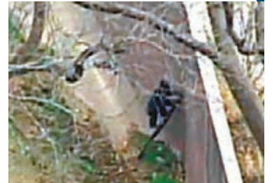
■猩猩用樹幹當梯，爬上10米高圍牆。網上圖片

猩猩作為人類近親，智力不容小覷，美國堪薩斯城動物園一隻猩猩為重過自由生活，竟將樹幹折斷當成梯，爬上10多米高的圍牆逃走，更教導其他6隻猩猩逃出生天。可惜智慧難敵天性，當工作人員出動芹菜、紅蘿蔔等美食後，眾猩猩最終乖乖重返籠牢。