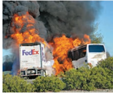
■意外發生後，現場火光熊熊。

美國加州北部日前發生致命交通意外，一輛聯邦快遞(FedEx)貨車疑閃避車輛時失控，在州際公路迎面撞上一輛載滿高中生的旅遊巴士及另一輛私家車，造成10死至少35人傷。當局要動用直升機將重傷者送院急救，事故原因仍在調查。