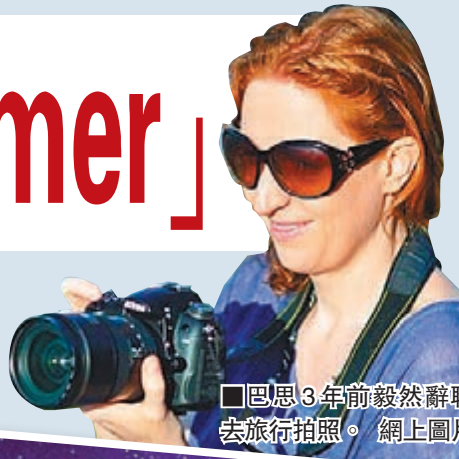
■巴思3年前毅然辭職去旅行拍照。

社交網站盛行帶來無限商機，澳洲一名女子於2011年辭任廚師後，周遊列國影旅行照，成為該國首名全職的照片分享程式Instagram用戶，更獲旅遊公司贊助。她的帳戶目前有35萬名用戶訂閱。