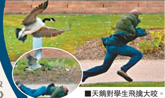
■天鵝對學生飛擒大咬。

天鵝素來予人溫馴高貴的形象，但英國華威大學的天鵝兇猛殘酷，更是群「極右分子」。牠們專門襲擊海外及少數族裔學生，鬧得校園雞犬不寧，校方近日只好在池塘邊築起木欄保護學生。