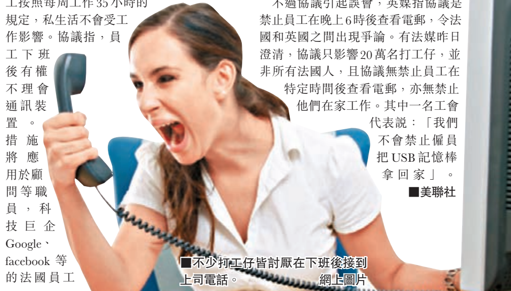
■不少打工仔皆討厭在下班後接到上司電話。